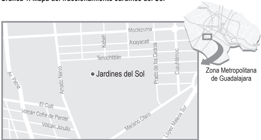
Gráfica 1. Mapa del fraccionamiento Jardines del Sol

de La Ciudadela, de industrial y espacios verdes abiertos a comercial y de servicios de niveles “distrital y central” para construir el megaproyecto. El director general de Obras Públicas aprobó la licencia correspondiente. Como factor agravante, una parte de ese terreno estaba contaminado con residuos químicos de talio, un metal pesado tóxico, radioactivo y cancerígeno.