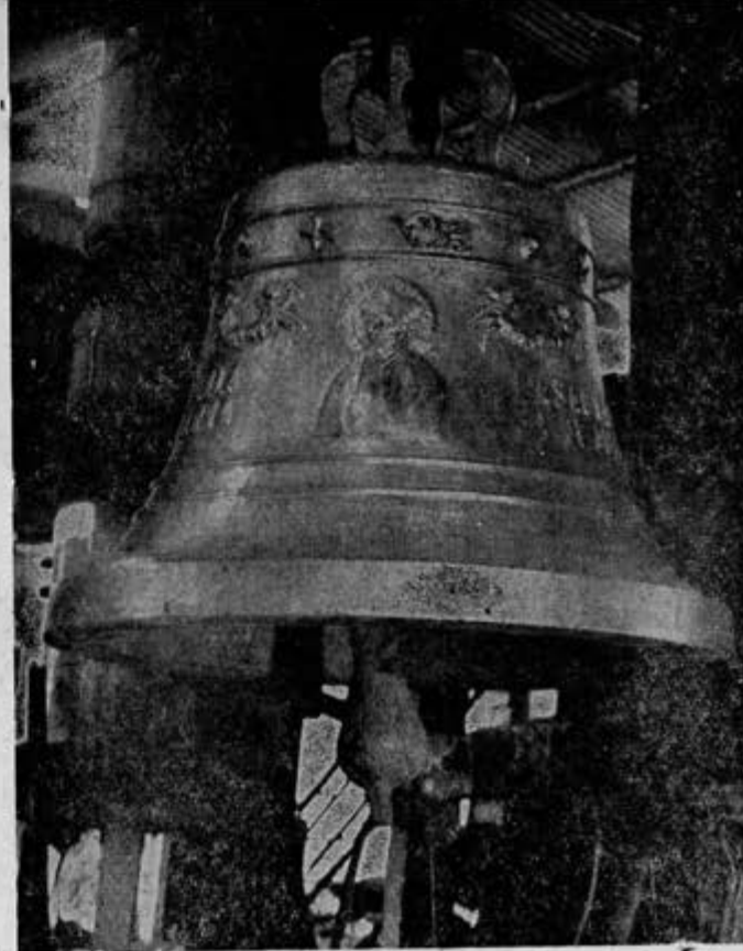
Esta campana fue fundida para la parroquia de la Sagrada Familia, Esq. de Puebla y Orizaba