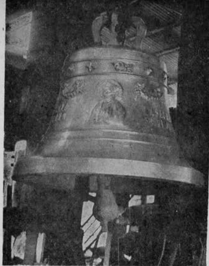
Esta campana fue fundida para la parroquia de la Sagrada Familia, Esq. de Puebla y Orizaba