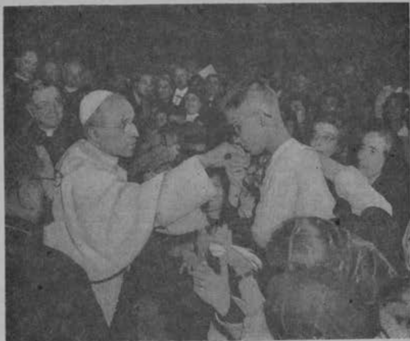
Llevaba siempre abierta y sensible la cristiana llaga de las calamidades del mundo.

A Alemania marchó Pacelli como mensajero de paz; se conquistó el amor de muchos y el respeto de todos. Pero chocó con el cerrado or-