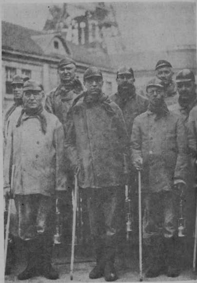
El Nuncio Pontificio baja a las minas del Ruhr.

de la diplomacia vaticana, y fue Pacelli, su fiel servidor, la mejor de sus fichas, el comisionado para la desesperanzadora tarea.