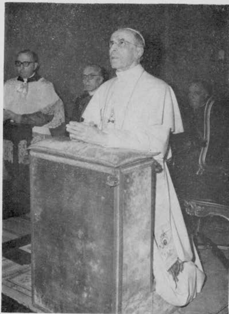
Esta es la última foto que se tomó en vida a S. S. Pío XII. El domingo 5 de Octubre asistió a la Capilla de Castelgandolfo a orar ante la Virgen del Rosario. Pocas horas después, el mal del que ya se notan huellas en su rostro, le obligaba a guardar cama, para morir en la madrugada del día 9.

Por lo mismo disponemos que en las parroquias lo más pronto que sea posible se celebre una Misa, se hagan rogativas y se multipliquen las oracio-