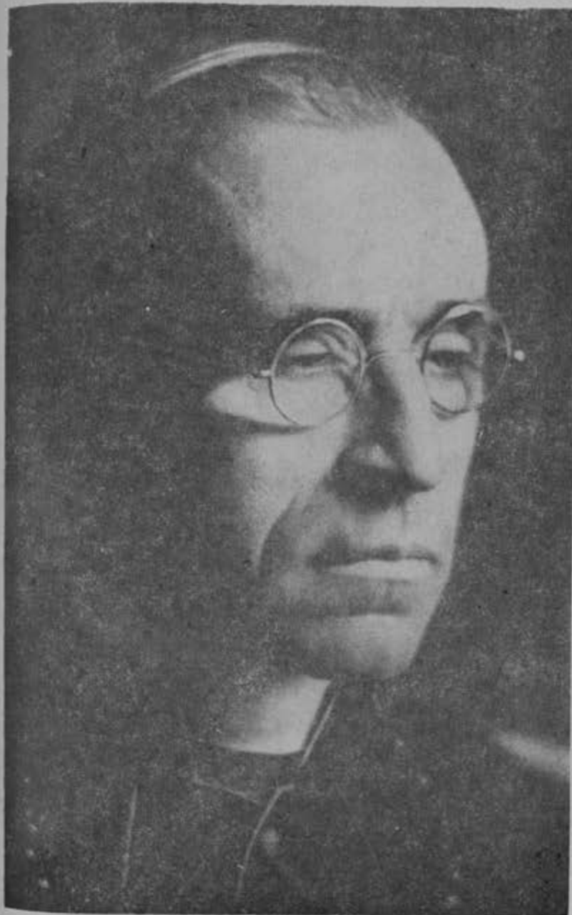
Eugenio Pacelli, Nuncio en Alemania.

Fue primero Benedicto XV, Vicario personal de Jesucristo, quien tomó el ingrato encargo de amansar la barbarie humana, enzarzada en la primera guerra mundial. Puso en actividad todos los recursos