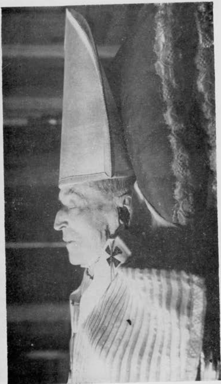
Ya en el Vaticano, en la Catedral de San Pedro, Pío XII fue colocado en el tándulo de dos metros de alto. Su cabeza tenía la mitra de plata de Obispo de Roma.

Pero atended a lo que nos dice el Sdo. Evangelio. Estaba Jesús rodeado de una inmensa multitud, que por todas partes le tocaba y oprimía. Muchos de aquellos que le tocaban, necesitarían tal vez recibir la salud de manos de Jesús; y sólo una pobrecita mujer, que cree firmemente, que si toca aunque fuese la orla de su vestido, quedará sana, es la única que obtiene instantáneamente la salud. Cando Jesús siente el contacto de la mujer, se vuelve a todas partes, diciendo: ¿Quién me ha tocado?" Y con gracia le responde Pedro: "Señor, la multitud te está oprimiendo por todas partes, y tú dices: ¿quién me ha tocado?" "Es que alguno me ha tocado de un modo especial", responde Jesús. Entretanto la pobre mujer, está toda asustada y temblando. Pero Jesús, volviéndose por fin a ella, atribuye el milagro que se ha realizado a la fe con que la mujer le había tocado: "Mujer, le dice, tu fe es la que te ha sanado".