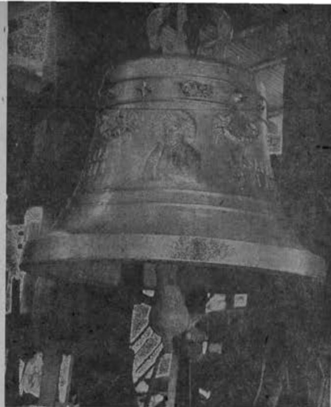
Esta campana fue fundida para la parroquia de la Sagrada Familia, Esq. de Puebla y Orizaba