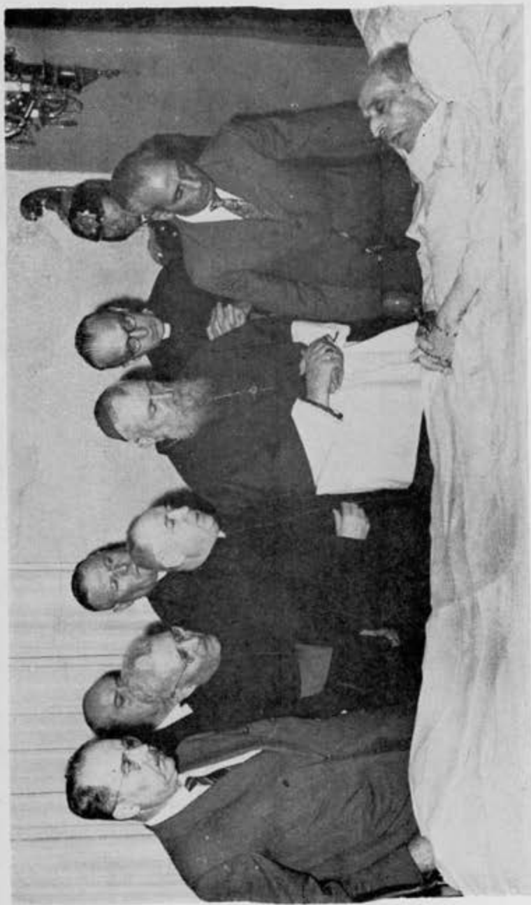
Momentos después de su fallecimiento, el Sumo Pontífice es observado con gran dolor, en el rostro de los circunstantes, entre los que se destaca el Cardenal Tisserant.