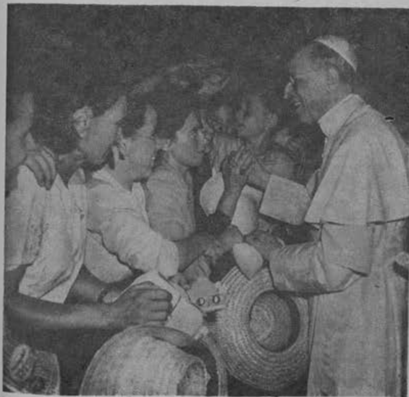
Gozaba... cuando su remolino de manos y caras intensas se le formaba en torno...

Cambiaron luego los vientos. Los aliados marchaban sobre Roma, y los refugiados del Vaticano podían salir. Pero entonces eran los otros los que corrían peligro; y por una misma puerta salían a la libertad los perseguidos de ayer, y entraban a ampararse los dominadores de la víspera, ahora en desgracia.