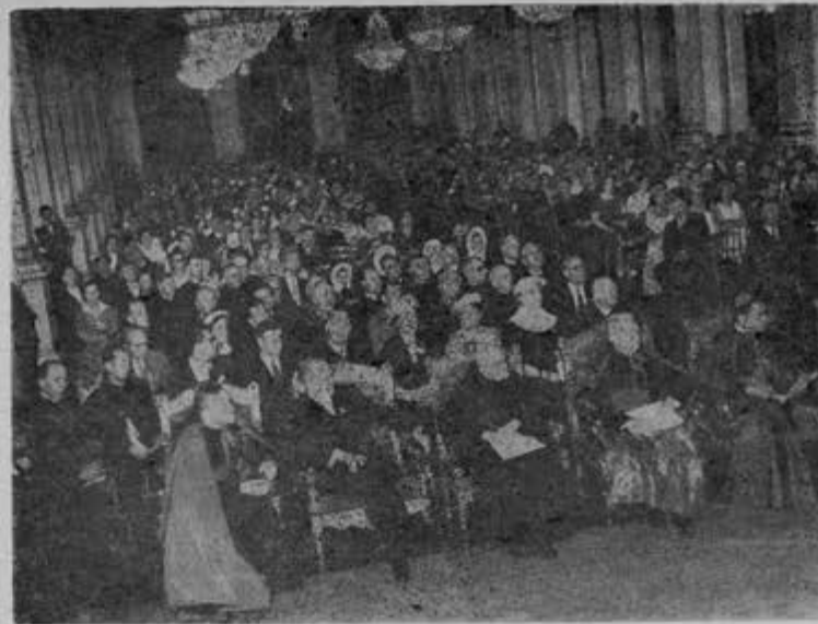
La Recepción Oficial en el Hotel de Ville, en París.

1º—La Carta que el Emmo. Cardenal Pizzardo, Prefecto de la Sagrada Congregación de Seminarios y Universidades, dirigió al Excmo. Rector del Instituto Católico de París para destacar pública y solemnemente la importancia de la formación musical de los seminaristas. Un resumen de tan precioso documento lo tenemos en el siguiente párrafo que transcribimos tomándolo de la traducción castellana publicada por "Ecclesia" de Madrid (agosto p. 10): "...es necesario que estemos todos convencidos de que jamás se podrá llegar a una duradera renovación litúrgico-musical, si no se comienza inmediatamente por la formación litúrgico-artística de los alumnos de los seminarios. Es evidente, en efecto, que la aplicación de las deliberaciones y de los votos de los congresos nacionales e internacionales de música sacra nunca serán posibles si no se comienza por la formación litúrgico-musical desde el primer año del seminario. De ahí que recomendamos al Congreso de París, que va a ser presidido por Vuestra Excelencia, releer y meditar las consideraciones de la Encíclica "Musicae Sacrae disciplina" sobre este punto fundamental".