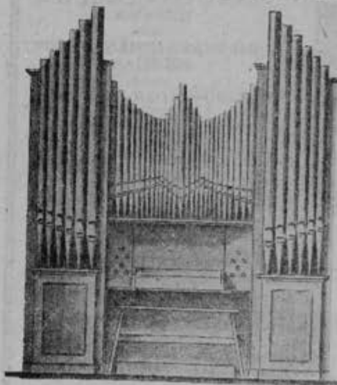
Walcker órgano Positivo Modelo N.