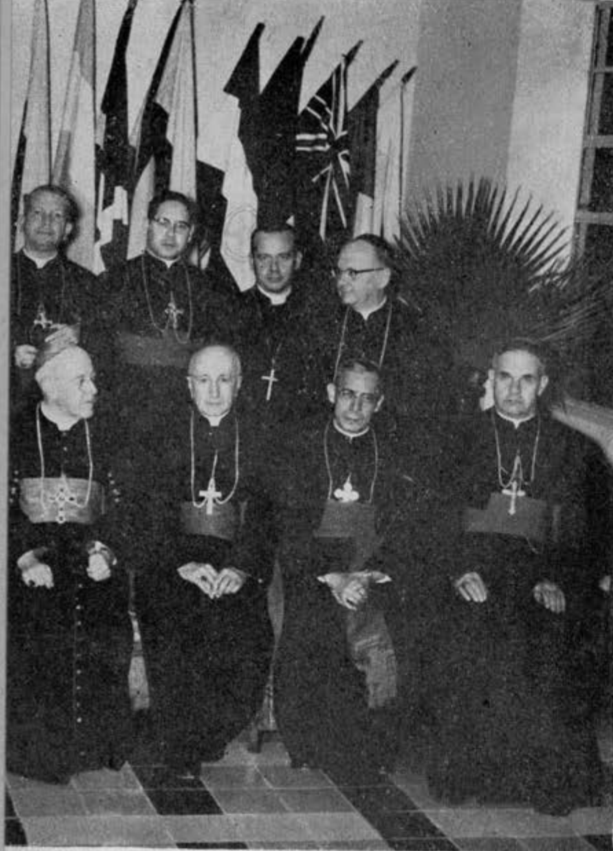
"CELAM" EN BOGOTA.

Mientras este importantísimo problema no sea resuelto con eficacia y definitivamente, la integración de nuestra patria no será per-