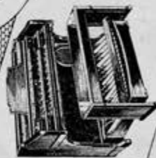
ORGANO ELECTRONICO Waldorf