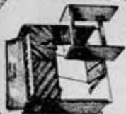
ARMONIO Armonía Creativa

BOSAS MORENO 87 MEXICO 4, D. F. TEL. 46 96-25