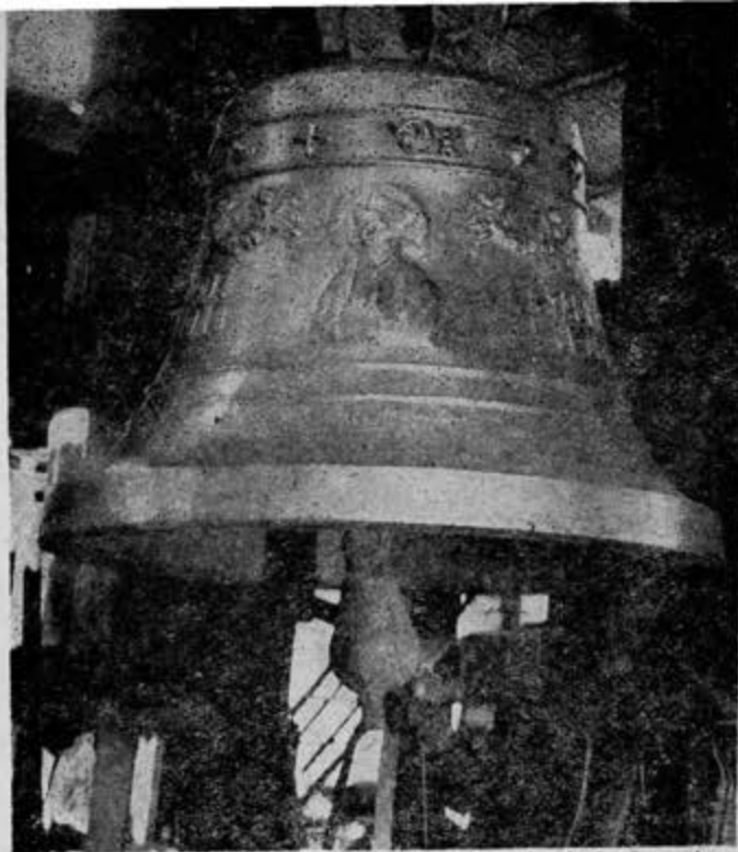
Esta campana fue fundida para la parroquia de la Sagrada Familia, Esq. de Puebla y Orizaba