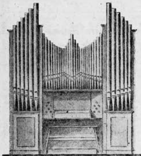
Walcker organo Positivo Modelo N.