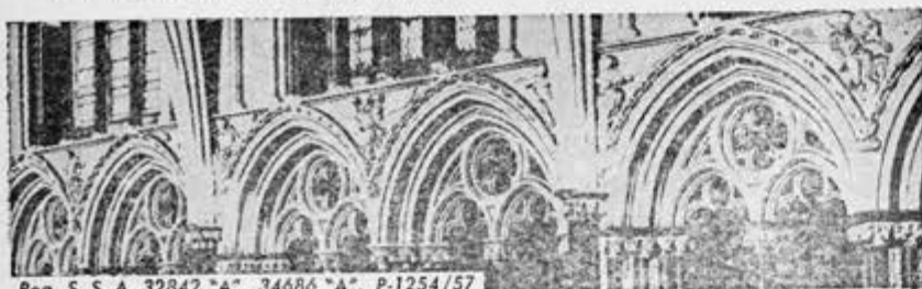
Reg. S. S. A. 32842 "A". 34686 "A". P-1254/57