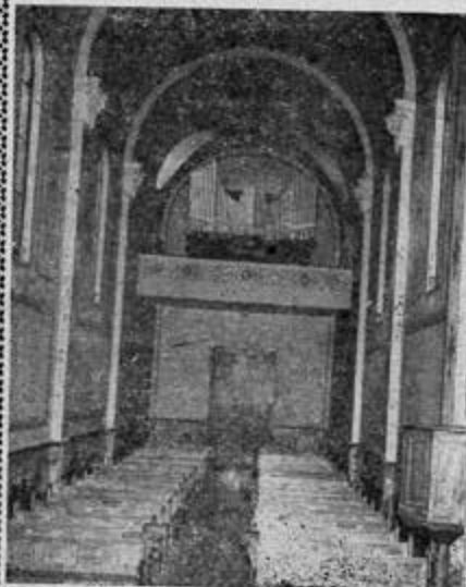
Organo Walcker de la Capilla Parroquial del Espíritu Santo.