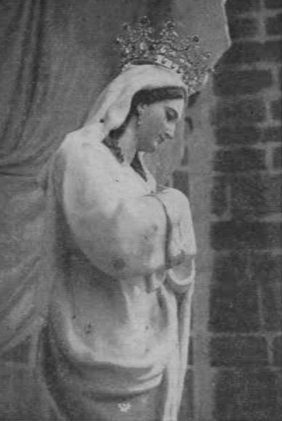
La bellísima escultura de la Purísima Virgen María, Coronada en Zamora.