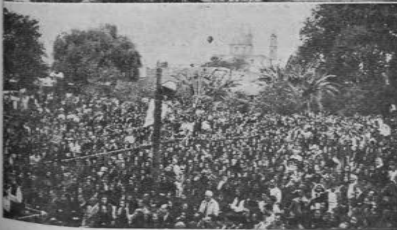
Tres imponentes aspectos de la solemne coronación de María Inmaculada, en Zamora, Mich.