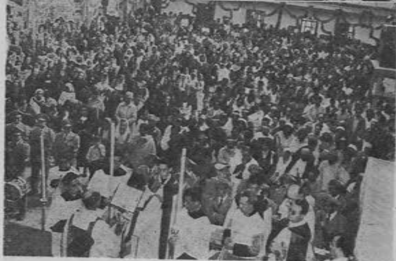
Nutrida concurrencia que asistió a la Pontifical en que ofició el Excmo. Sr. Obispo de Chiapas.

los juegos pirotécnicos. Entre estos una cosa admirable fue un "castillo" que iba representando las apariciones de la Sma. Virgen de Guadalupe con fuegos de policromía.