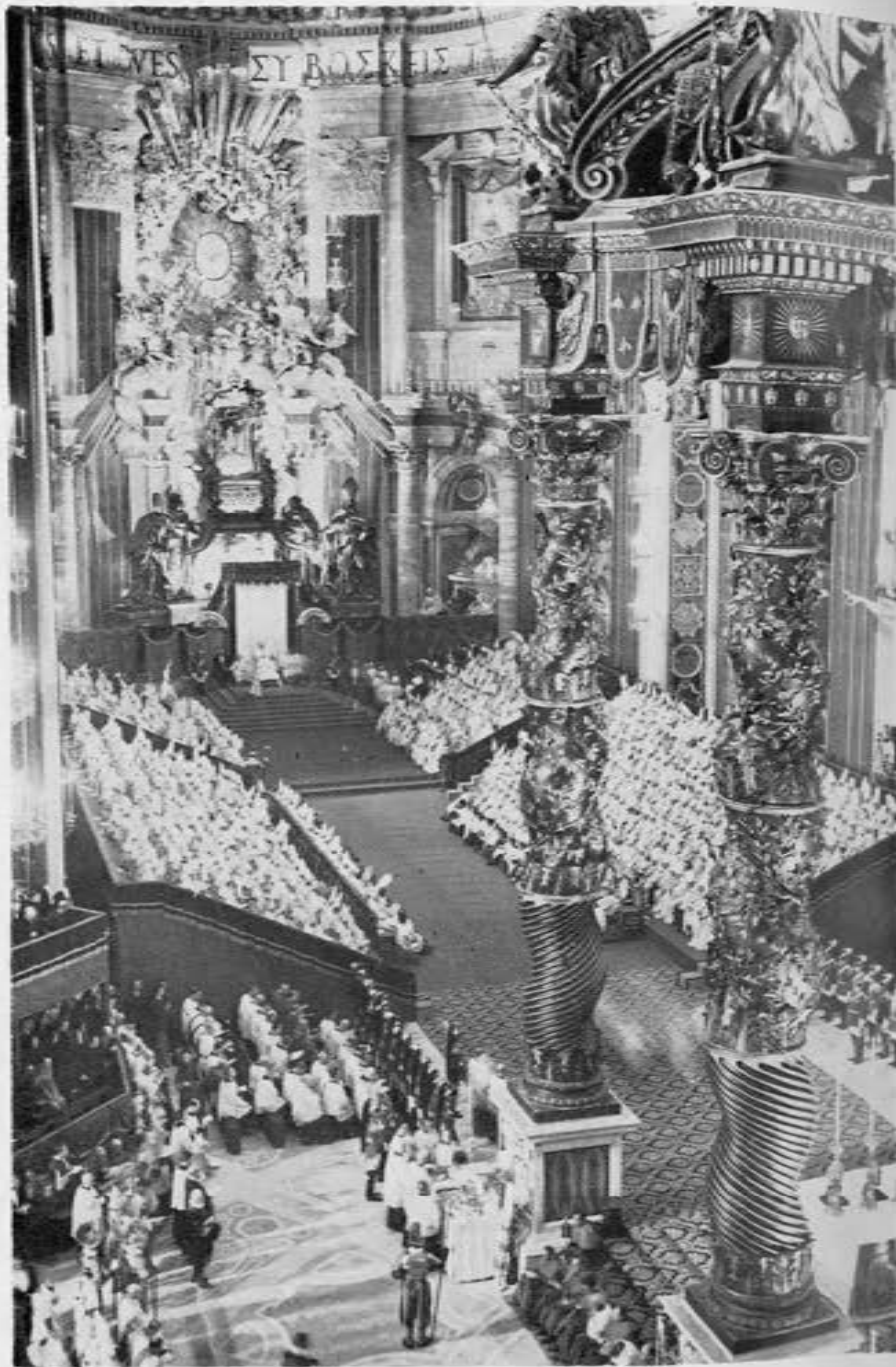
Grandioso aspecto de la Basílica de San Pedro el día 1° de Noviembre: en el fondo, el Santo Padre en su trono, debajo de la tradicional Silla de San Pedro y de la Gloria del Bernini; a sus lados los Cardenales y los numerosos Arzobispos y Obispos.