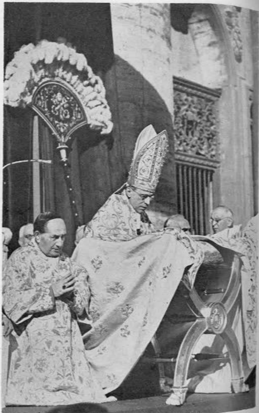
El Santo Padre en oración, antes de hacer la Definición Dogmática de la Asunción. A su derecha, el Emmo. Card. Cavali.