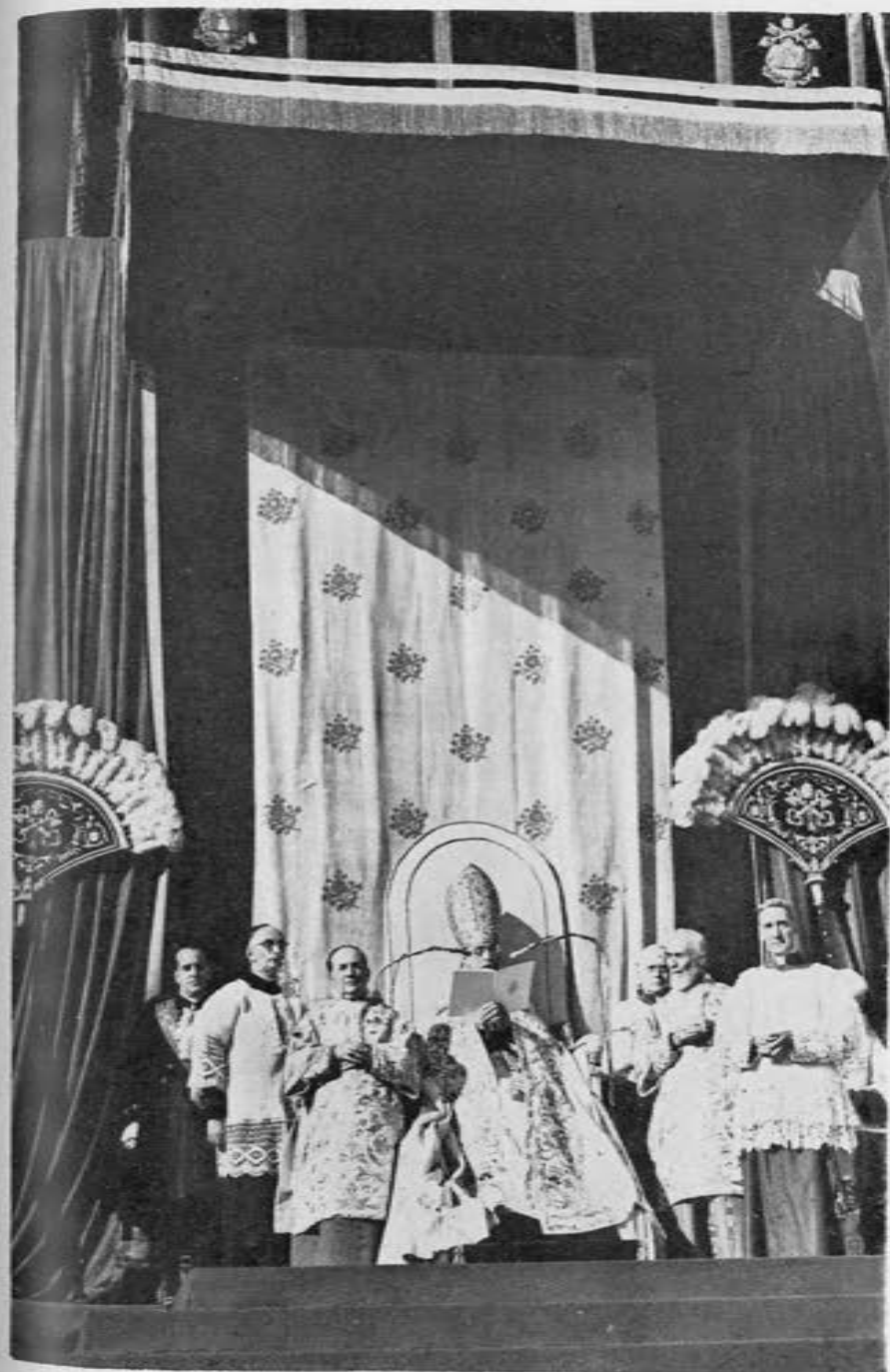
S. S. Pío XII leyendo la Bula "Munificentissimus Deus".