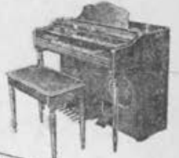
MODELO 44 SPINET Gracioso modelo contemporáneo, dos manuales inclinados con teclas suaves, muy fáciles de manejar. Pedal Spinette de 13 notes, abarca escala completa.

DISTRIBUIDORES EXCLUSIVOS CASA RIOJAS BOGAS MORENO No. 27 MEXICO 4, D.F. TELS. 16-43-93 y 30-58-78