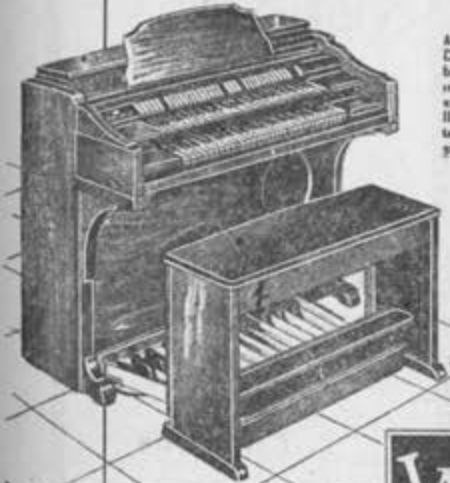
MODELO 4601 ALTA FIDELIDAD Diseño de exquisito buen gusto. Ataque instantáneo sin ser explosivo; maravilloso por su completa variedad de registros.

EL ADELANTO MAS NOTABLE DEL SIGLO EN MATERIA DE SONIDO!!