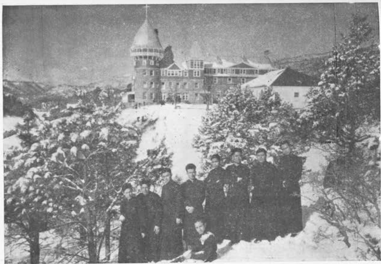
Seminario Central de Ntra. Sra. de Guadalupe, Montezuma, N. M., Estados Unidos. — ¡La primera nevada!