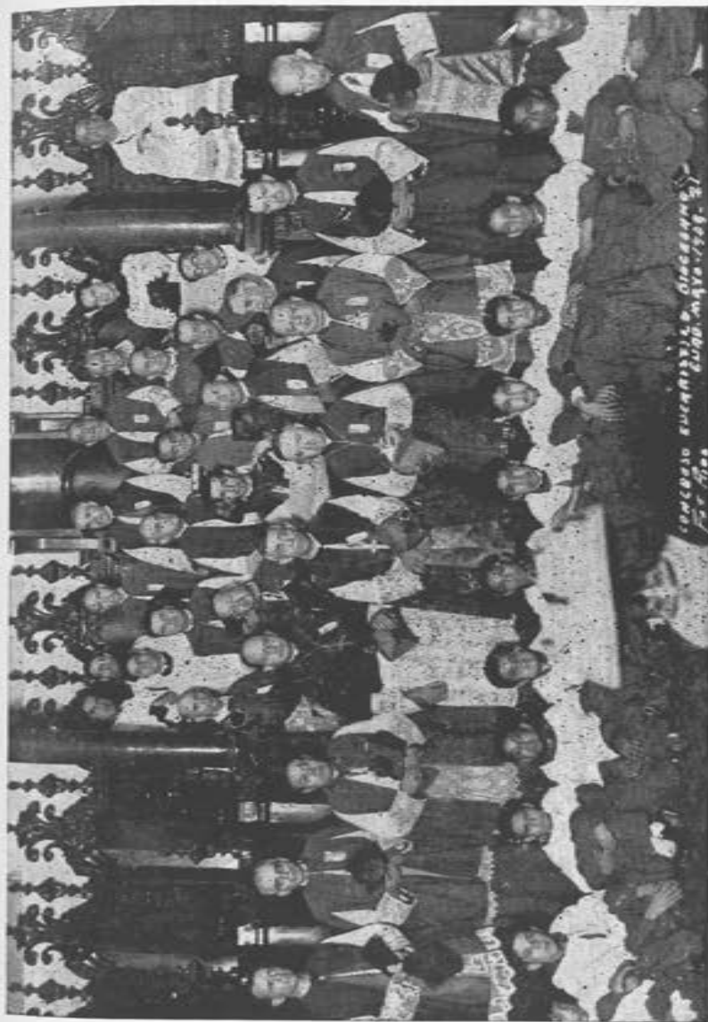
CONGRESO EUCARISTICO DE GUADALAJARA, Los EE. y RR. Prelados Asistentes y el Vble. Cabildo.

Un decreto de la misma S. C. de fecha 14 de mayo de 1856 había resuelto que puede tolerarse la costumbre introducida en muchas partes de to-