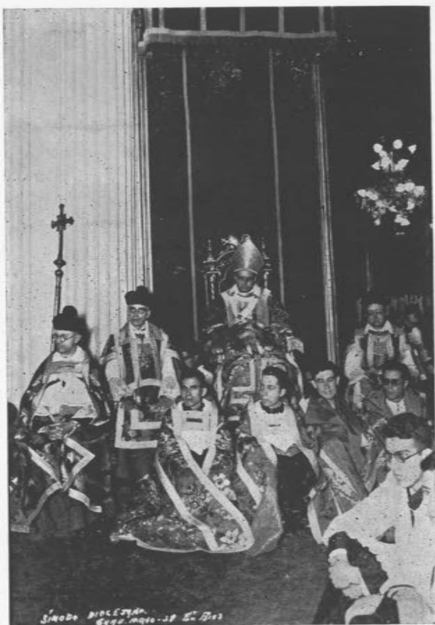
PRIMER SINODO DIOCESANO DE GUADALAJARA. - El Excmo. y Remo. Sr. Dr. D. José Garibí Rivera, en la Misa Pontifical.

Circular N° 25. — Mayo 18 de 1938. — Se ordena la Colecta en favor