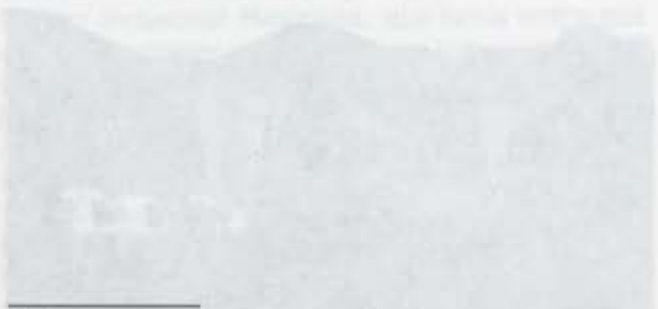
9 Ángel Hermida Ruiz, Acayucan y Río Blanco: gestas precursoras de la revolución, Jalapa, Veracruz, Dirección General de Educación, 1964. P. 65.