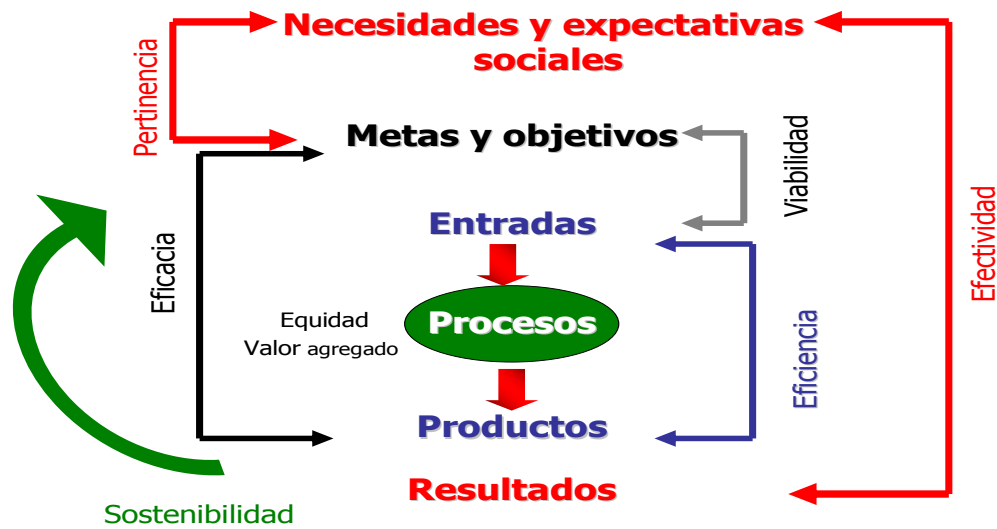
Figura 1. Criterios de calidad

Los criterios de calidad se aplican en los distintos momentos de los procesos de evaluación, de acuerdo con una visión sistémica e integral (figura 2). Esto permite evaluar la calidad de todos y cada uno de los elementos a lo largo del proceso, desde el momento en que se genera la idea de un programa, hasta el momento en que se verifica si se ha logrado el impacto esperado.