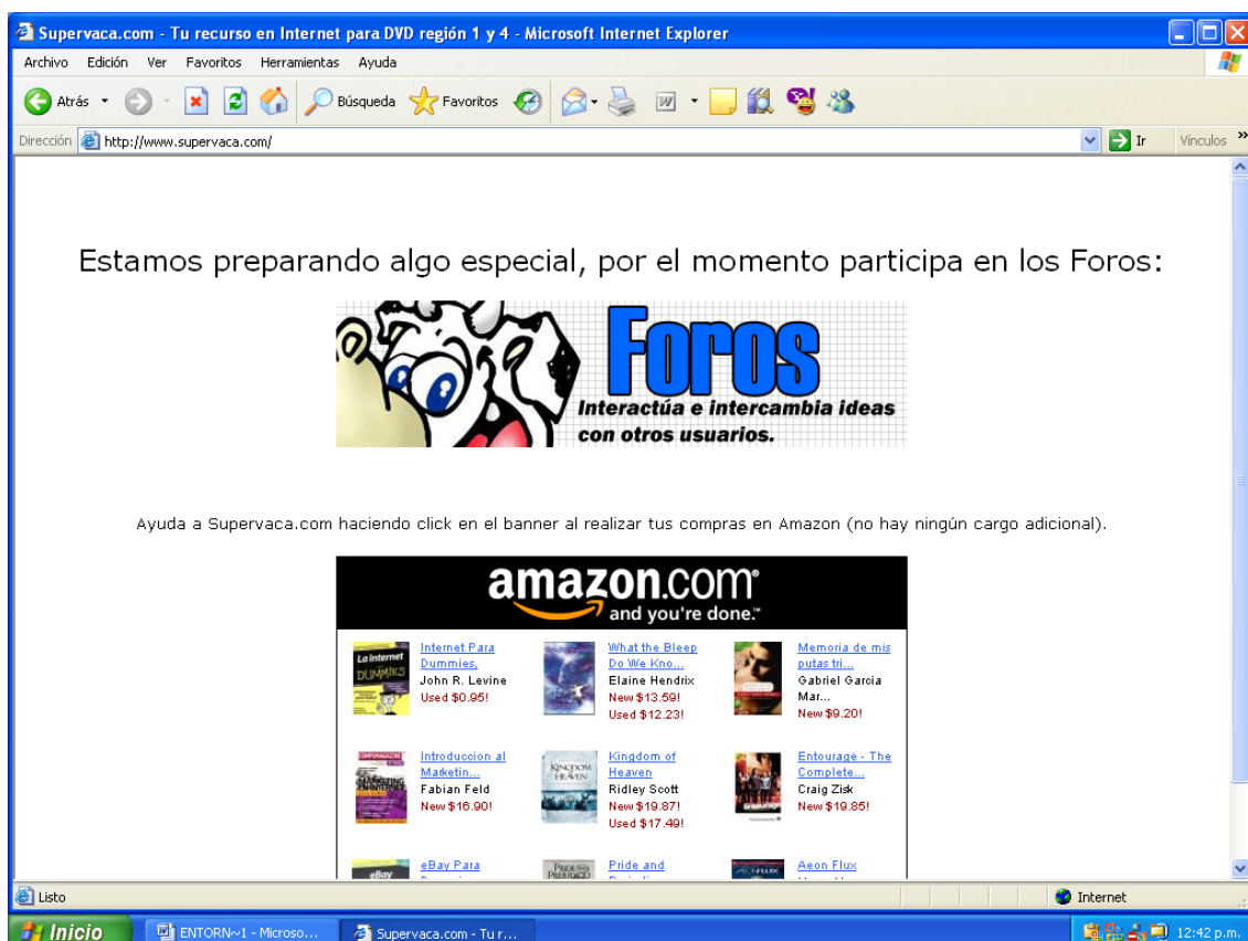
FIGURA 1 PORTAL SUPERVACA

Supervaca puede ser definida como una comunidad virtual. Este sitio surge a finales del 2002 con la intención de compartir datos técnicos de películas en