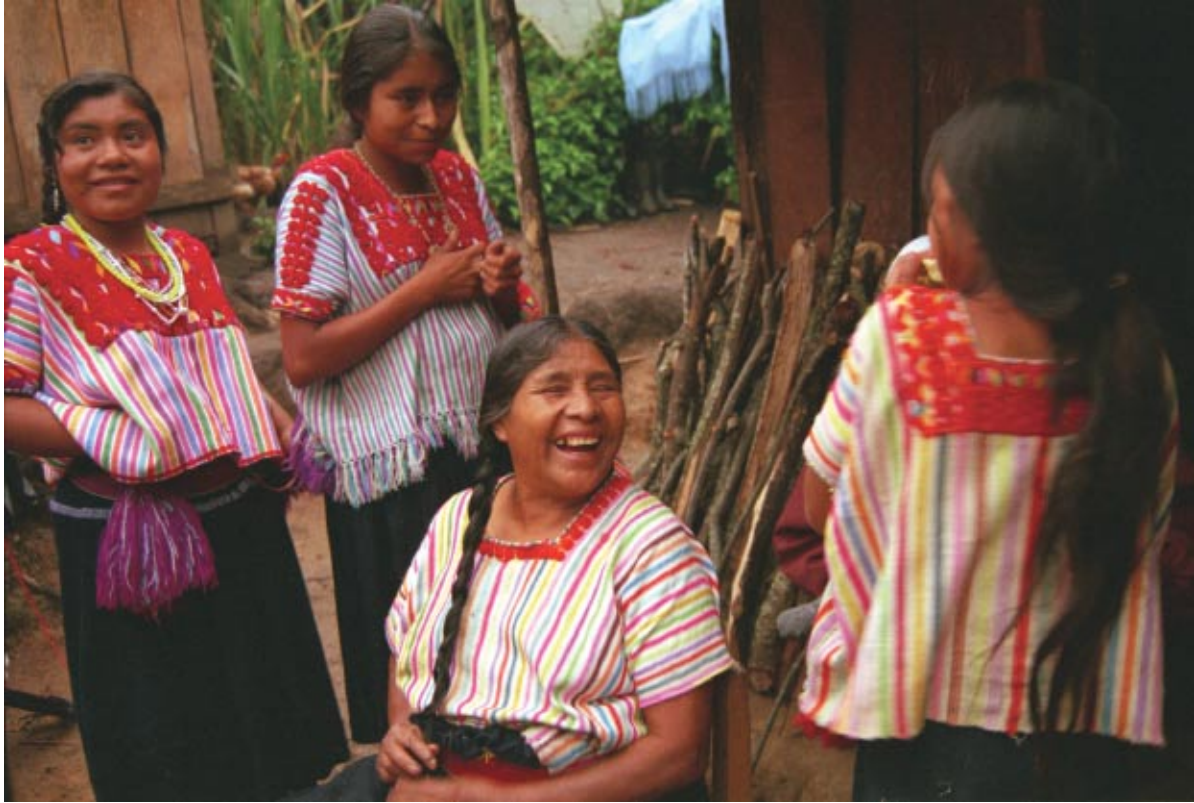
PARTERA. FOTOGRAFÍA FIJA EN COLOR DEL DOCUMENTAL CHENALHÓ, EL CORAZÓN DE LOS ALTOS, X'oyep, Chiapas, 1999.

Su segundo encuentro fotográfico con este estado del sureste de la república lo tuvo como parte del equipo que realizó Chenalhó, el corazón de los Altos (dirigido por su hermana Isabel Cristina en 1999, y en donde estuvo encargada de la fotografía fija a color), un documental que retrata la difícil vida cotidiana de los niños y sus familias desplazados de sus comunidades.