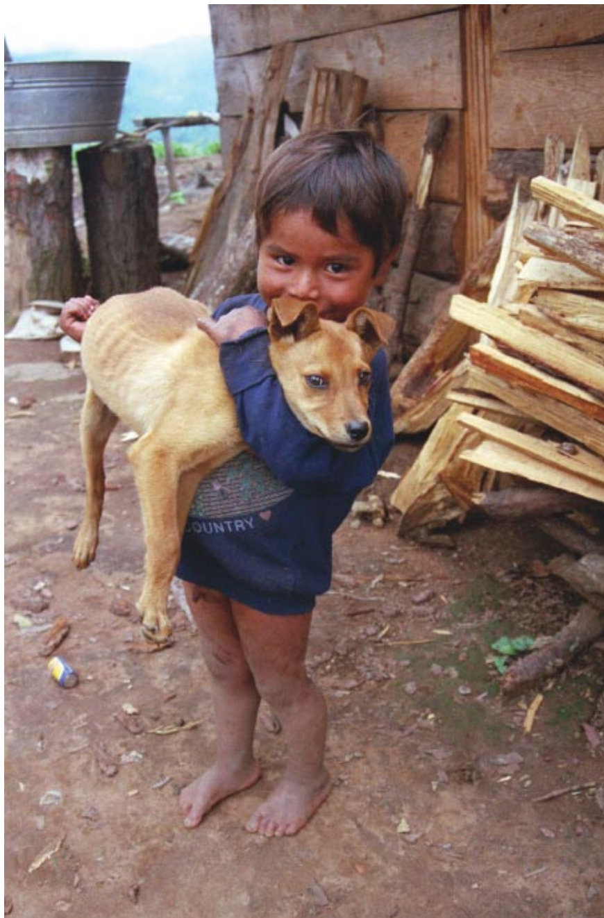
NIÑO CON PERRO. FOTOGRAFÍA FIJA EN COLOR DEL DOCUMENTAL CHENALHÓ, EL CORAZÓN DE LOS ALTOS, X'oyep, Chiapas, 1999.