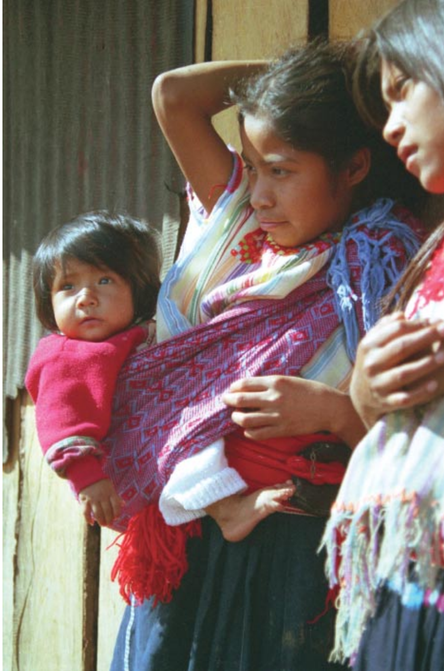
NIÑAS INDÍGENAS CON NIÑO. FOTOGRAFÍA FIJA EN COLOR DEL DOCUMENTAL CHENALHÓ, EL CORAZÓN DE LOS ALTOS, X'oyep , Chiapas, 1999.