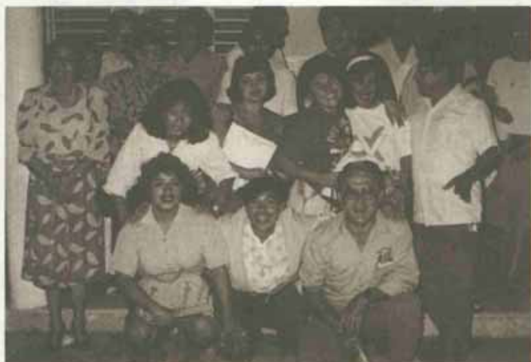
Taller de las Comunidades de Mérida, Yucatán.

También conviene anotar que lo que se dice en referencia al proceso del grupo, puede aplicarse personalmente a quien quiere comprometerse en la CVX desde su integración a una comunidad ya hecha.