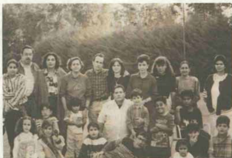
Miembros de la reunión en León, Guanajuato.