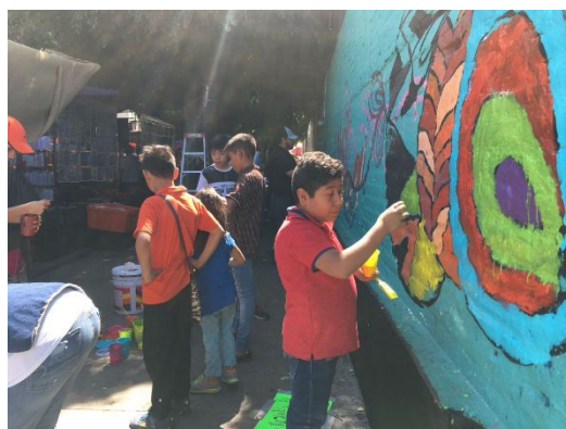
Ilustración V. Niños de la zona participando en la realización del mural