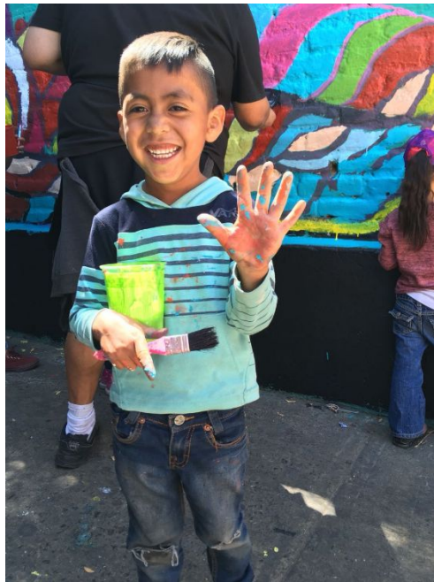
Ilustración VII. Niño contento tras pintar el mural de su colonia y su escuela