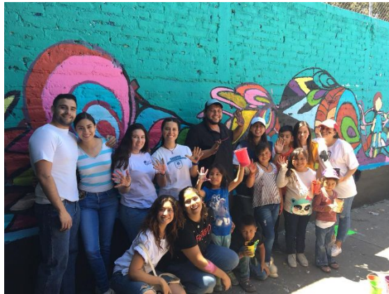
Ilustración IX. Participantes en la realización del mural (alumnos del PAP y comunidad)