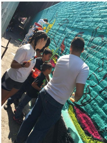
Ilustración IV. Elaboración del mural en conjunto, habitantes de la zona junto con los alumnos del PAP