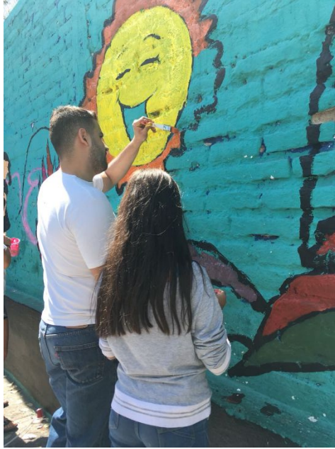
Ilustración VI. Pintando mural de la primaria