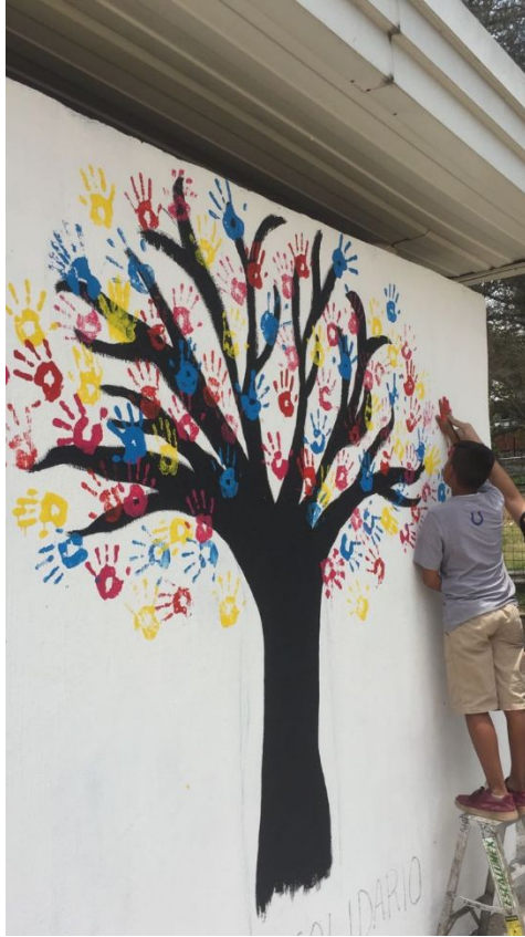
Ilustración X. Elaboración del mural del establecimiento localizado en el parque central