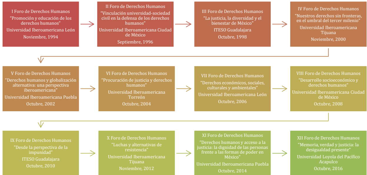
Figura 1. Cronología de los Foros de Derechos Humanos del Sistema Universitario Jesuita de 1994 a 2016.

En seguida se describen los eventos a detalle. A partir de que no se logró recuperar lo suficiente de todos los foros, la información que se despliega no es del todo homogénea. Sin embargo, se ha tratado de plasmar en la forma más explícita y organizada posible. Se organizaron tres bloques generales de información: el contexto social y político del año en el que se desarrolló el foro (intento de ubicación); la descripción de cada uno, y una breve mención del Reconocimiento Tata Vasco.