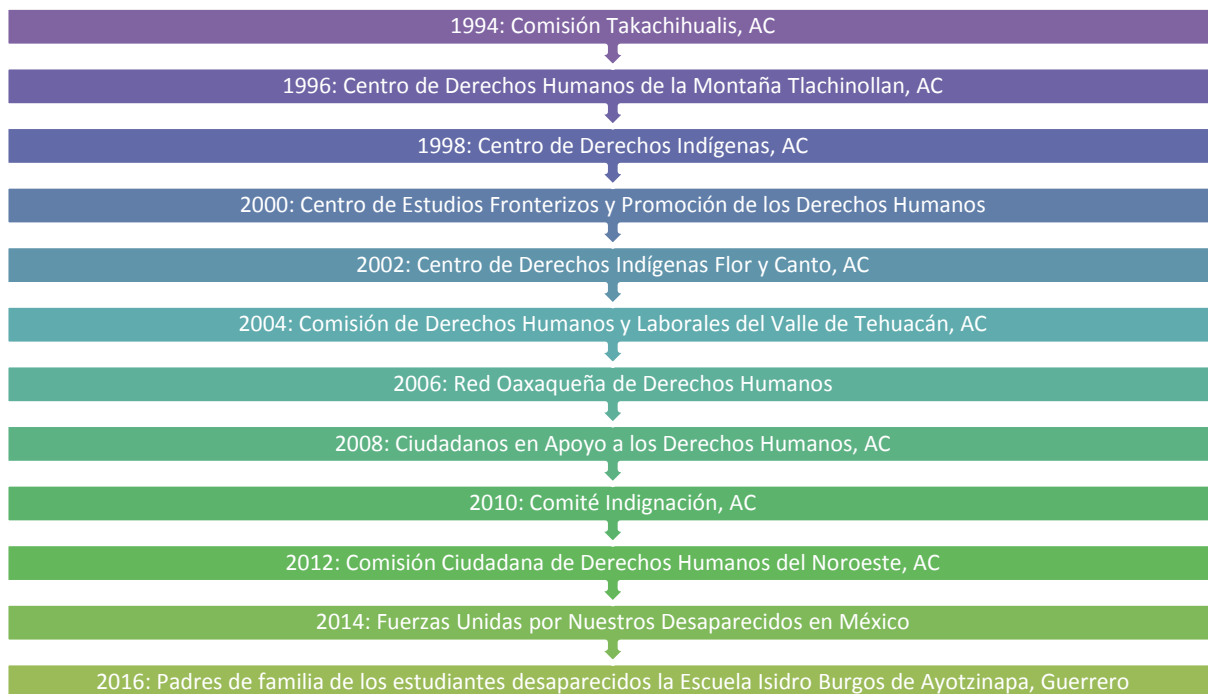
Figura 3. Organizaciones de la sociedad civil galardonadas con el Reconocimiento Tata Vasco, (1994–2016).

defensa y promoción de los derechos humanos, sobre todo de los sectores más desprotegidos de México.