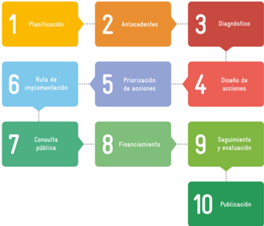
Tabla 11. Ruta de desarrollo de Programas Municipales de Cambio Climático de Jalisco

Según la Guía para la Elaboración o Actualización de los Programas Municipales de Cambio Climático del Estado de Jalisco (2018) elaborada por la SEMADET, esta es la ruta que deben seguir los planes ante el CC.