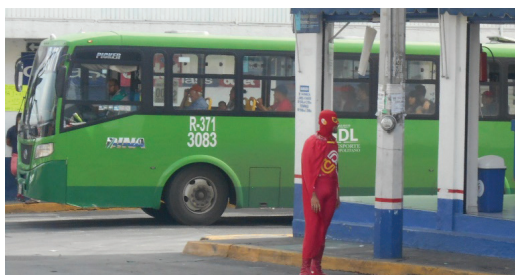
Imágenes 8 y 9

El estilo de la publicidad exterior y sus mensajes varían según las zonas modificando el paisaje, en unos casos abarrotando de mensajes espectaculares (sobre todo en avenidas y vías rápidas); en otros con la presencia de lonas de imprenta o carteles hechos a mano (en especial en colonias populares); recurriendo al interjuego con las formas arquitectónicas o, incluso, vistiendo el cuerpo de personas contratadas para anunciar.