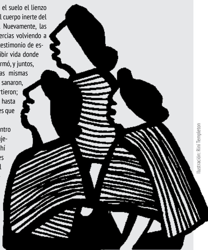
Ilustración: Rimi Templeton

Este mismo vigor lo encuentro en el testimonio de muchas mujeres que van germinando vida ahí donde se encuentran: mujeres que no se dejan definir por el silencio y el temor, sino que gritan: "¿Dónde están?" "¿Ni una más!" "¿Yo sí te creo!" "¿A mí también!" Gritos que nos van sacando de nuestras inercias y que nos van impulsando a abrirnos a vivir de otra manera.