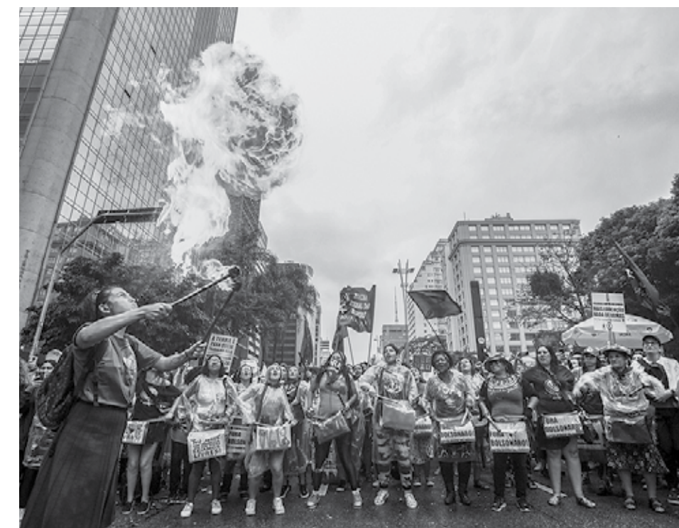
8 de marzo en Brasil

Ponemos el cuidado de la vida en el centro, politizándolo con el objetivo de ir más allá de su visibilidad, pues es nece-