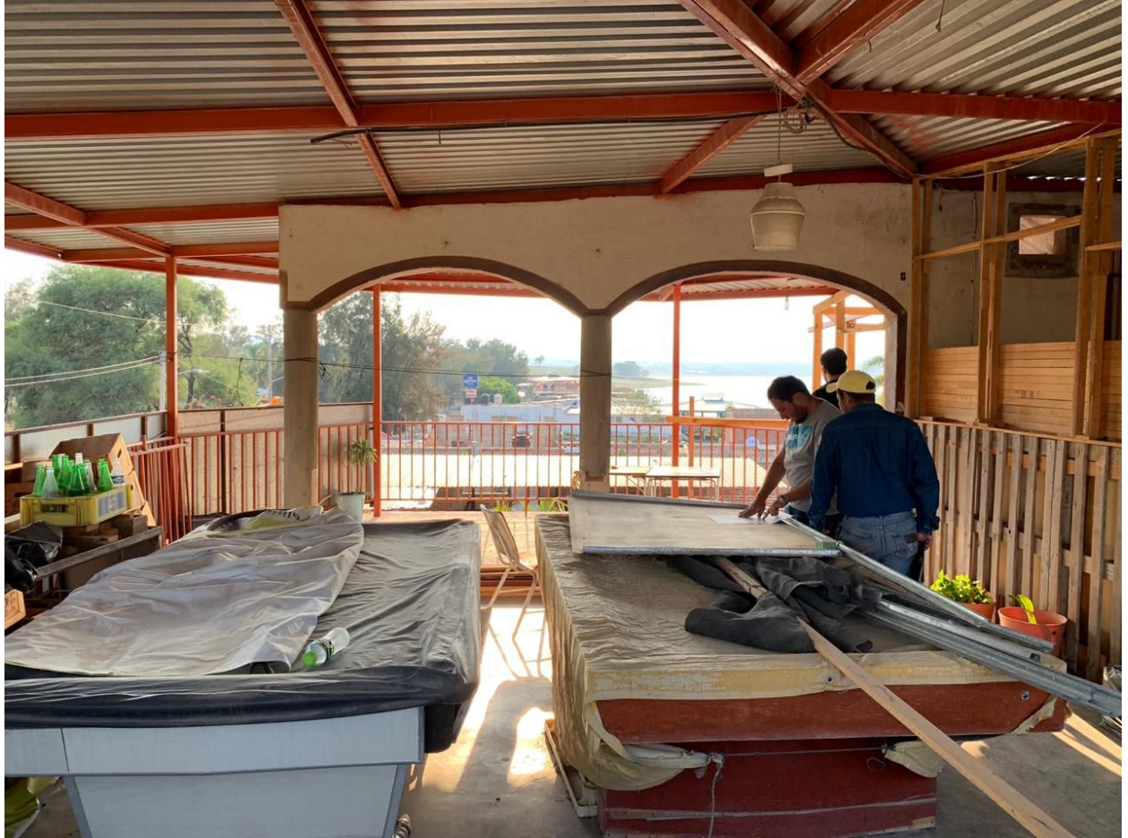
Discusión de reorganización habitacional