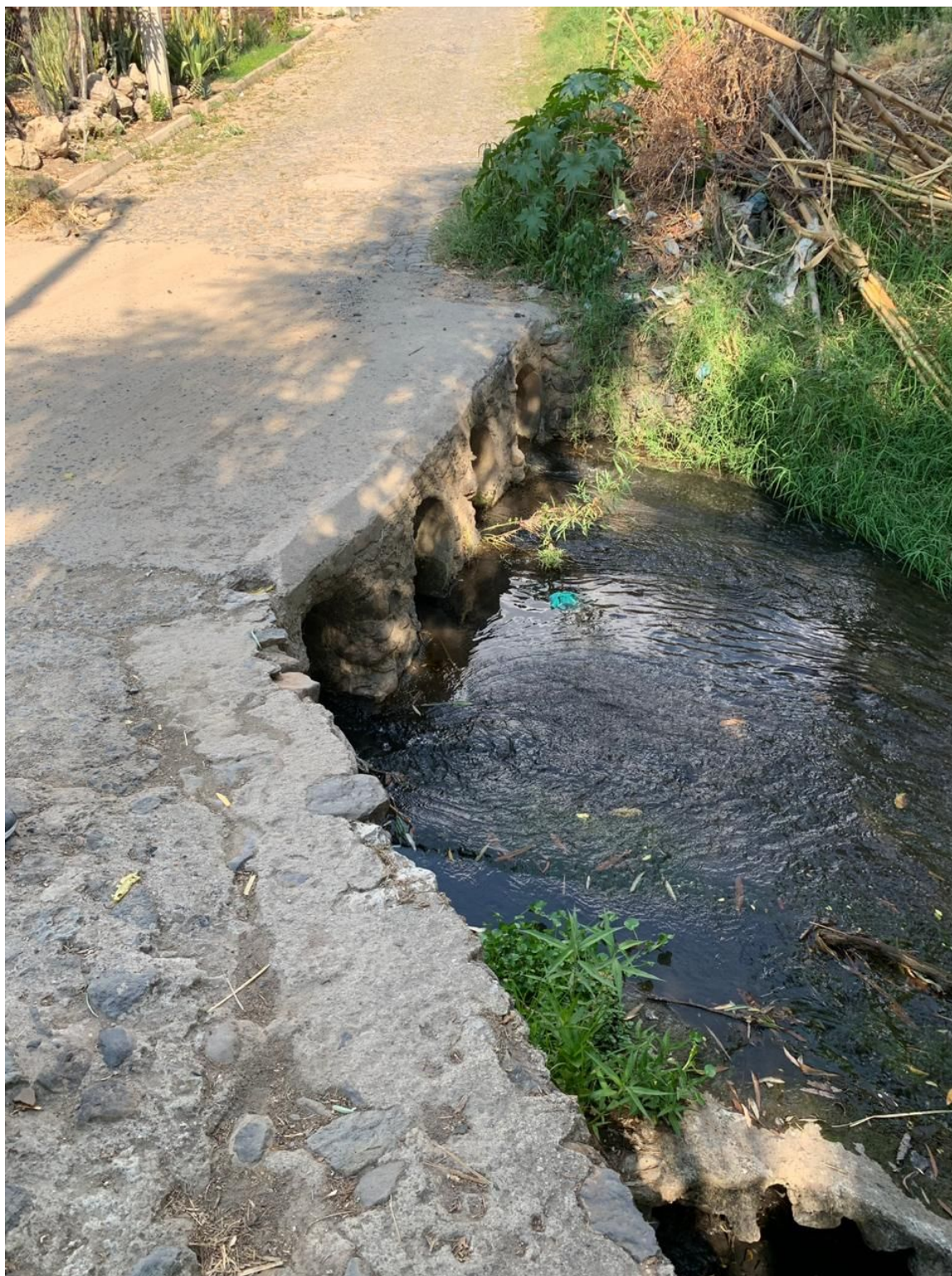
Área hidráulica bajo el puente insuficiente y obstruida por basura.