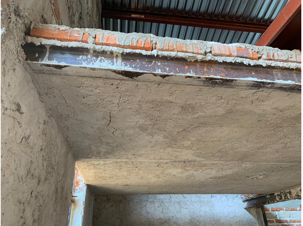
Viga pequeña para posibles cargas vivas que esperadas en un coro.