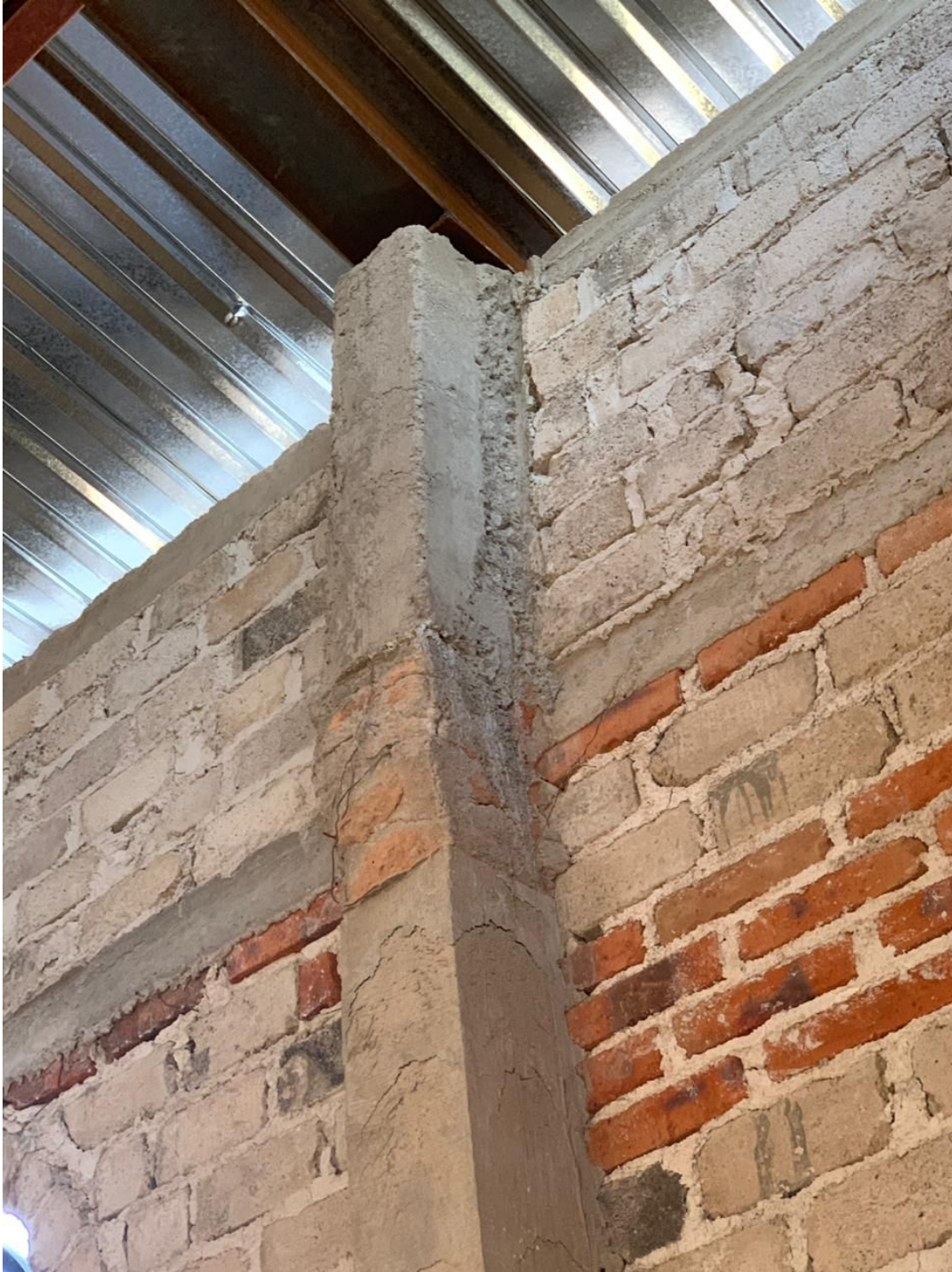
Discontinuidad en el concreto de la columna de carga.