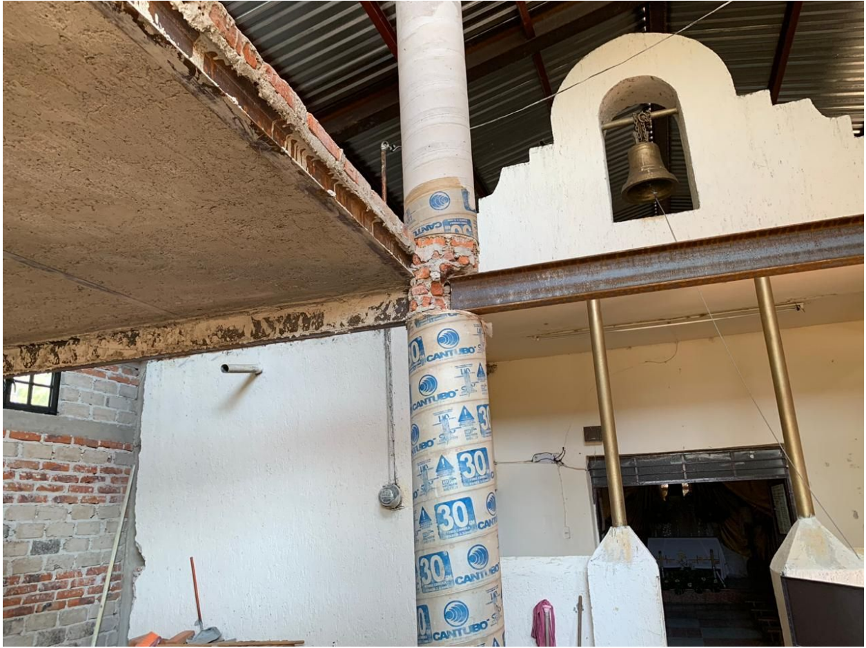
Conexión viga - columna y continuación de columna con ladrillo inadecuadas.