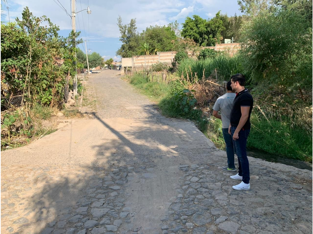
Claro y alrededores del puente.