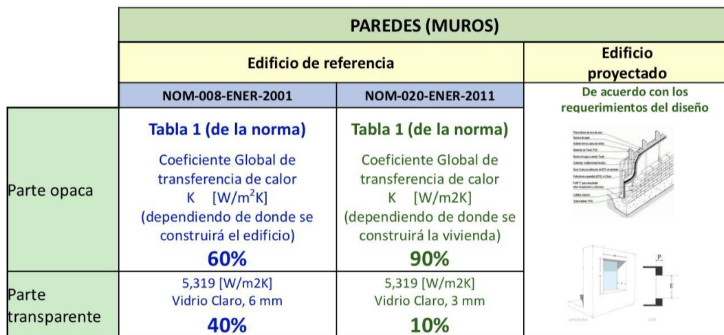
Imagen 1: Especificaciones para los componentes del envoltente.

Los edificios nuevos o ampliaciones a edificios existentes incluidos en el campo de aplicación de esta Norma que se construyan en la República Mexicana deben incorporar una etiqueta que proporcione a los usuarios una relación de la ganancia de calor solar del edificio proyectado con relación al edificio de referencia, al igual que en la norma anterior, la etiqueta no debe de ser removida y debe de ser colocada en el acceso o vestíbulo principal.