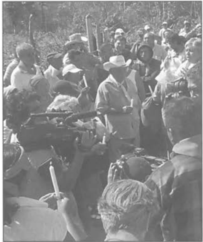
Habitantes de Ebulá, Campeche, rezan en el borde de su tierra