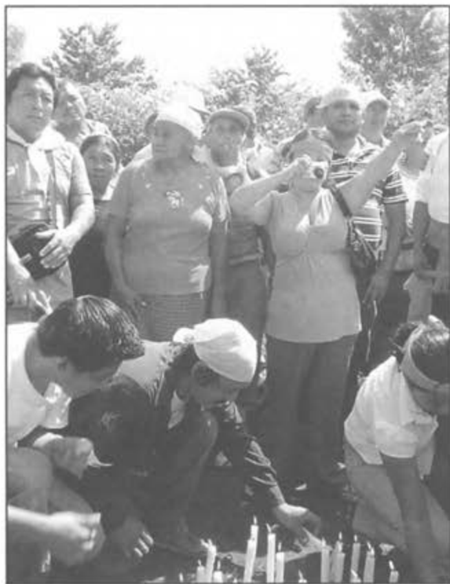
Ebuleños rezan en su tierra el día del intento del retorno