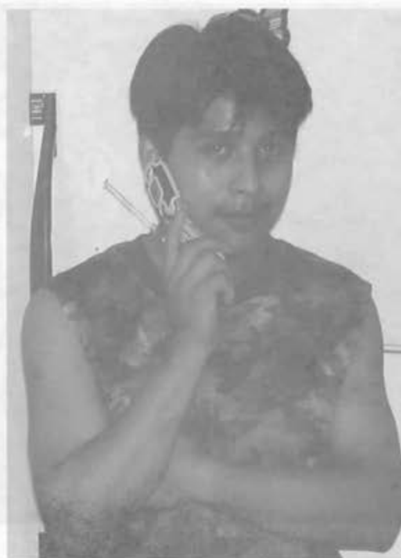
Migrante Otomí (Nueva York)

Parece como si los pueblos indígenas hubieran decidido jugar el reto de los tiempos adversos, plagado de riesgos, en la guarida misma de los que traman los planes de etnocidio con su banco mundial y sus fondos monetarios.