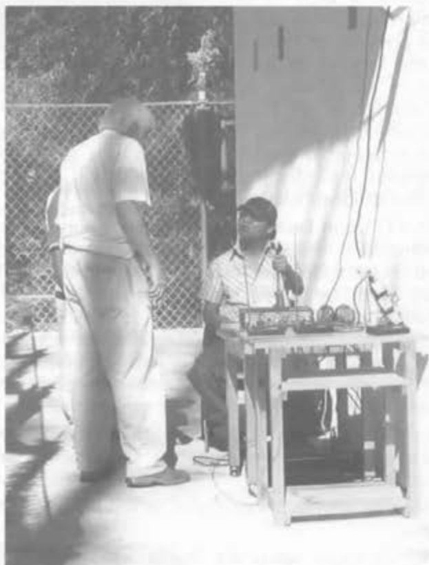
En Radio Huayacocotla (Ver.)

El permiso a Radio Huayacocotla para utilizar la frecuencia lo entregó la Secretaría de Comunicaciones a la Universidad Iberoamericana y la operación de la radio fue confiada al equipo de SER de México, compuesto por promotores laicos y dos religiosas que se capacitaron previamente para su tarea en Radio Sutatenza de Colombia. El Centro Nacional de Comunicación Social (CENCOS) participó en toda la gestión, la asesoría y la orientación social la nueva escuela radiofónica. La