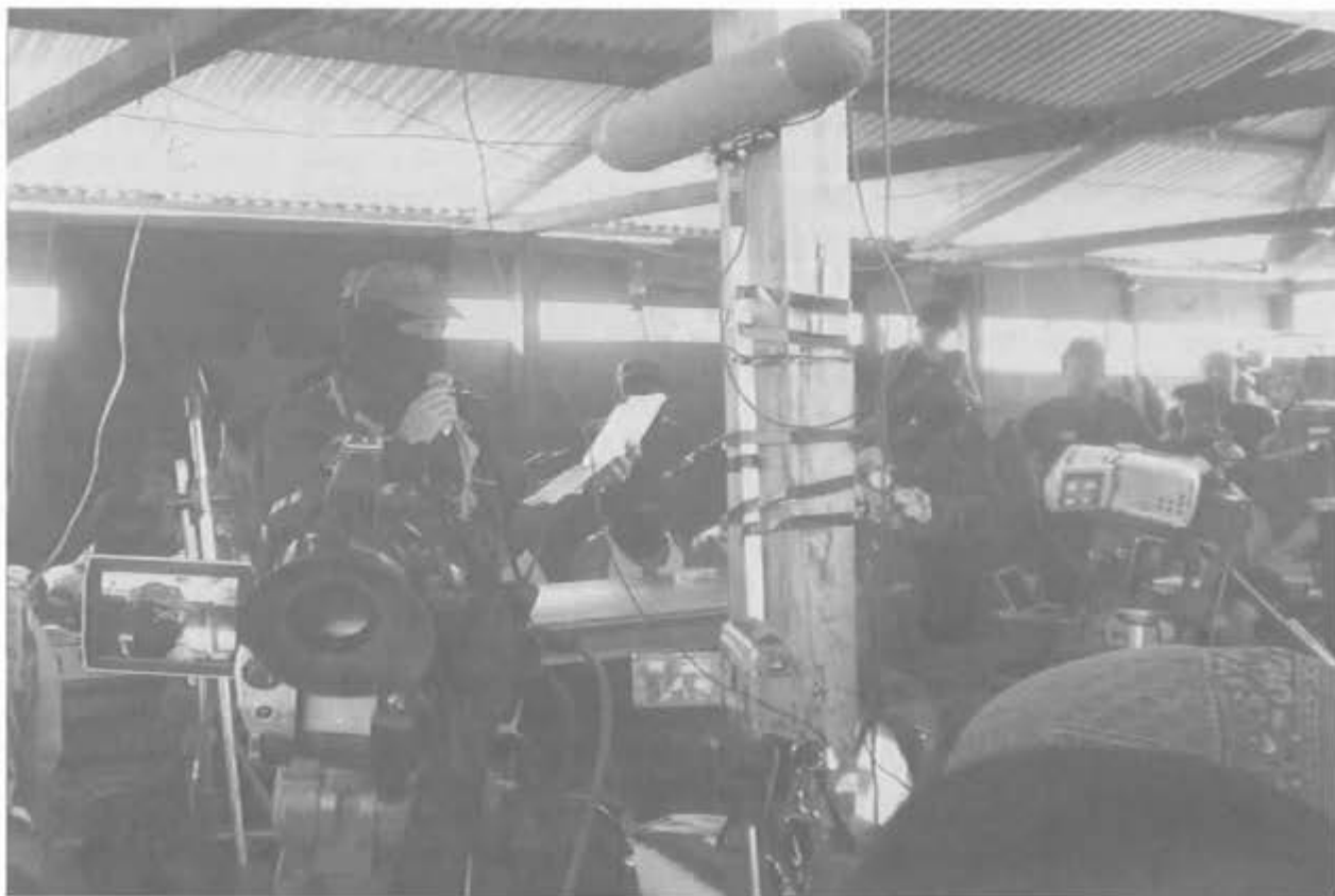
Dolores Hidalgo (Chis.) Sept. de 2005