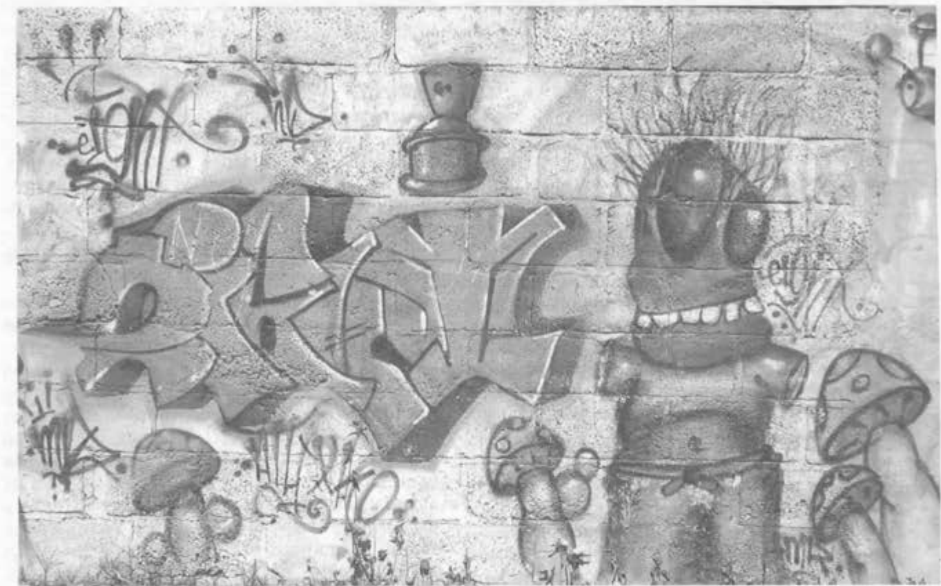
Graffiti en la colonia Ajusco (D.F.)