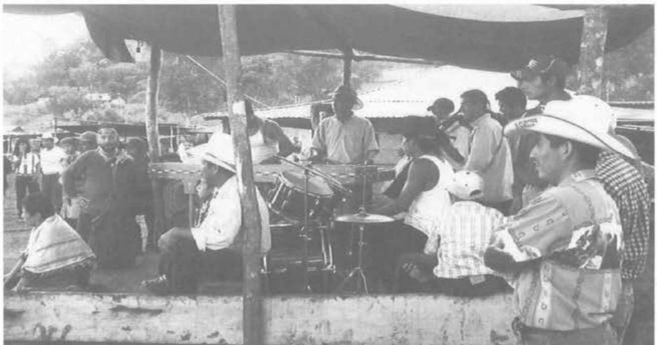
Dolores Hidalgo (Chis.) Sept. de 2005