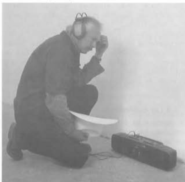
Operador de radio Huayacocotla

contextualización en los medios, por lo general su tratamiento es muy puntual y no hay una apertura constante (sobre todo de la TV) a su trabajo. Eso hace que con frecuencia se cometan imprecisiones, omisiones. Dentro de los muchos prejuicios contra estos grupos, se les ha llegado a tipificar como «defensoras de delincuentes» y demás juicios ajenos al compromiso y generosidad de quienes, a veces a costa de su vida, participan en estos grupos. Por ello, por lo general, en nuestras sociedades desiguales, poco respetuosas de los valores civiles, sin mucha cultura democrática, no es infrecuente que el grueso de la población tenga una imagen poco precisa cuando no interesada. Pero en ese sentido, hay siquiera ahora una mirada de los grandes medios, aunque sea puntual y utilitaria de algunas prácticas.