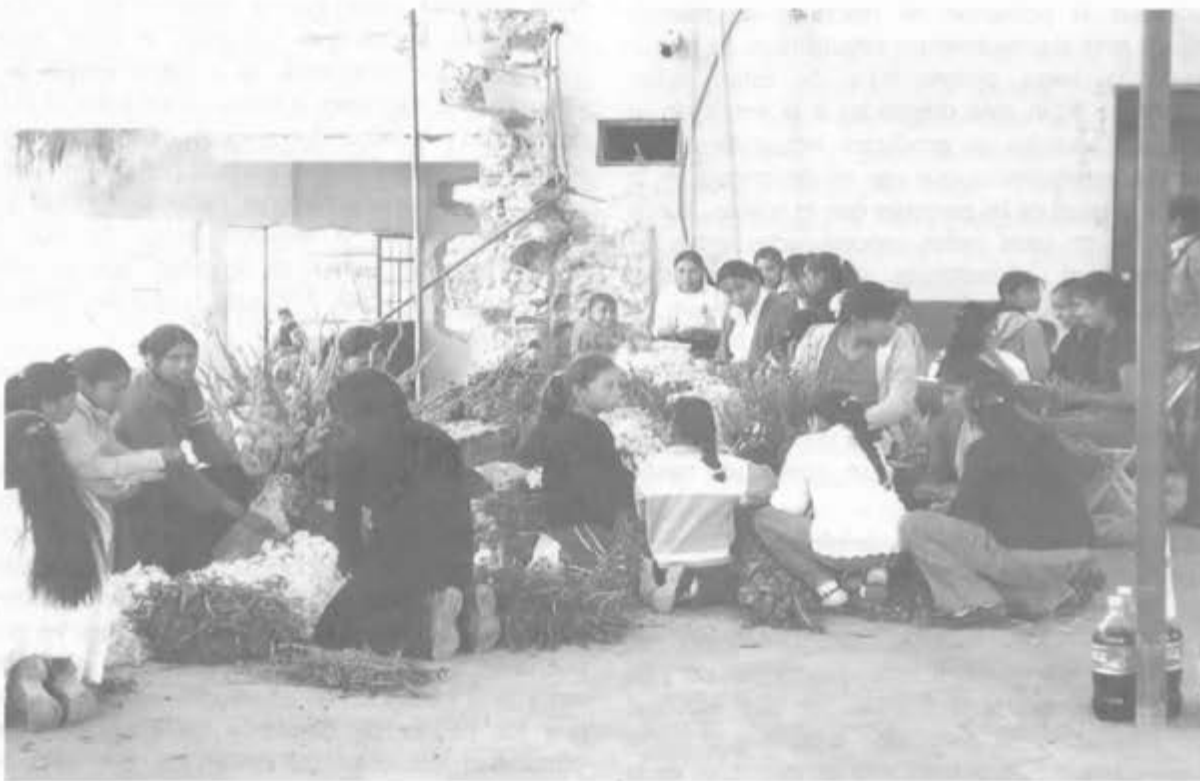
Comunidad de S. Miguel Papaxtla (Pue.)

Este medio de comunicación tiene como objetivo principal la expresión de los mazatecos de Mazatlán, de su sentir, su forma de vivir; el idioma que como pueblo ha utilizado a través de las generaciones. Además representa una alternativa para conocer las necesidades