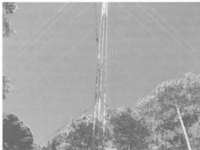
Atena de radio Huayacocotla (Ver.)

Caminando con esas limitaciones técnicas, Radio Huayacocotla pudo nutrirse de la vinculación con las radios culturales de América Latina en la Asociación Latinoamericana de Educación Radiofónica (ALER) a la que perteneció desde el inicio. Se propuso, además de las orientaciones del año 77, apoyar las organizaciones campesinas, que en ese tiempo surgían en la zona, para impulsar las iniciativas de producción y desarrollo