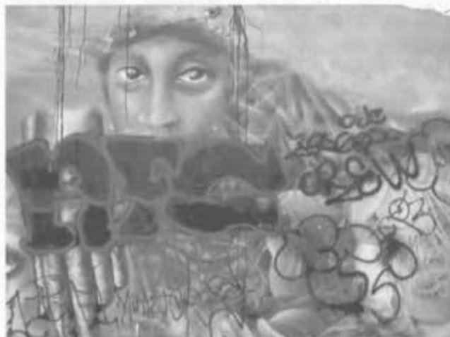
Graffiti en la colonia Ajusco (D.F.)

La magia de los colores. Lo que son capaces de comunicar estos jóvenes por medio de sus pinturas es más de lo que imaginamos. Sus graffitis producen sentimientos varios en sus espectadores, es interesante cómo la gente se sorprende por la capacidad de representar realidades por medio de los aerosoles y todo el contexto en que se desarrolla el graffiti hace desatar sentimientos que valoran el aporte de estos jóvenes dentro de la sociedad. El hecho de que son jóvenes que desde la marginalidad desarrollan sus capacidades artísticas da un toque distinto a sus pinturas y esto también tiene que ver con los sentimientos que logran desatar en quienes los contemplan.