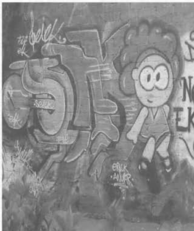
Graffiti en la colonia Ajusco (D.F.)

son placas o seudónimos que utiliza cada joven y que pinta en la barda, poste o anuncio comercial sin permiso del propietario. Normalmente serán letras elaboradas entre 5 ó 10 minutos; el reto es hacer una placa complicada en el menor tiempo posible. El tipo de letra utilizada en el graffiti ilegal, es la bomba, el tagg, los throw ups, o la publicidad del neograffiti, urban art, etc. El gusto de hacer este tipo de graffiti tiene que ver con sentir la adrenalina, transgredir las reglas, ser protagonista, ser visto y valorado por otros graffiteros. El