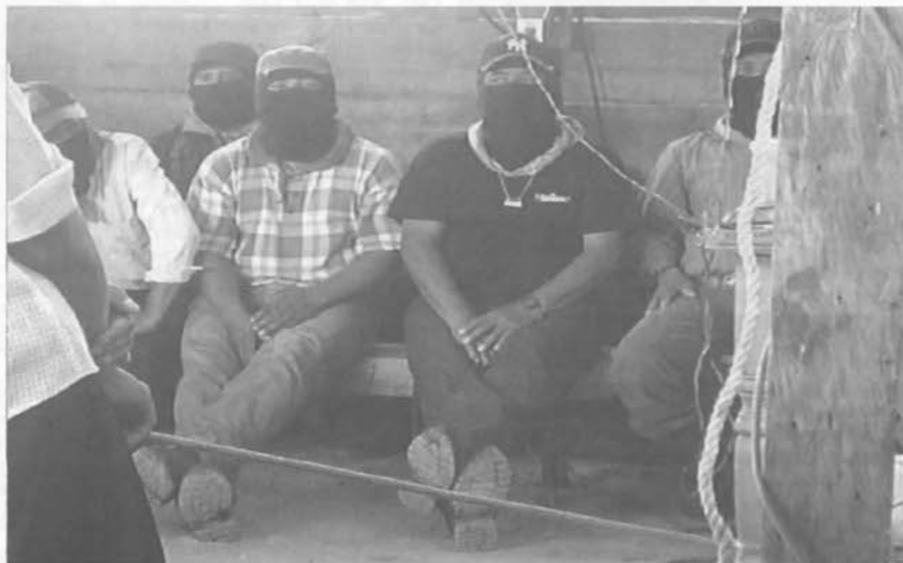
Dolores Hidalgo (Chis.) Sept. de 2005

Este proyecto supone un nuevo tipo de imaginación que se conjunta a los objetivos y aportes de la CP y CA. Si bien sumamente breve la mención que hacemos del proyecto de la UPMS no hemos querido dejar de mencionarlo. Este proyecto es una actualización de lo popular, lo comunitario, lo educativo y lo alternativo; desde la práctica esta «Universidad» obliga a una nueva teoría «desde abajo» y en diálogo intercultural; es un modo de fundar lo «alternativo», pero ya no en una direccionalidad discursiva o accional, sino dentro de una tradición de gran sensibilidad (e indignación) frente a la desigualdad; propugna, al poner en común movimientos de diversas culturas, cuños, y referentes tradicionales, una vigal del ser humano, una articulación auténtica de actores, tendencias y movimientos que van reconociendo, como sabiamente decía hace 40 años Juan XXIII, que es más lo que nos une, que aquello que nos separa; desde esta premisa se refunda la solidaridad y esa vocación comunitaria necesaria para hablar hoy día de cualquier modo alternativo de comunicación. ☐