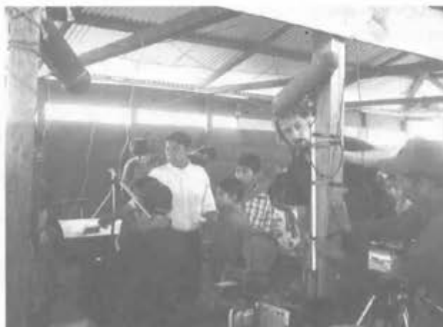
Dolores Hidalgo (Chia) sep. de 2005

interesante entre algunas prácticas de CP o CA y la comunicación educativa a través de «educación para los medios», educación a distancia o experiencias de recepción crítica de los medios 1 . La historia de la CP con más de 30 años contaba entre sus experiencias las radios mineras de Bolivia de los cincuenta, la prensa popular brasileña durante la dictadura, las radios campesinas en Veracruz, México, o la enseñanza de la defensa popular a través del video en El Salvador, los proyectos de educación radiofónica a distancia de Asociación Latinoamericana de Radio (ALER), las escuelas de formadores populares en Mendoza (Argentina), por mencionar algunos ejemplos 2 .