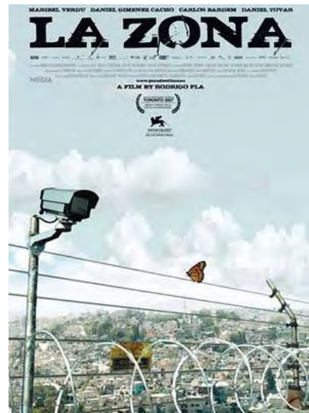
El cartel de la película La Zona

El circo de la mariposa (The Butterfly Circus) , dir. Joshua Weigel (Estados Unidos 2009)