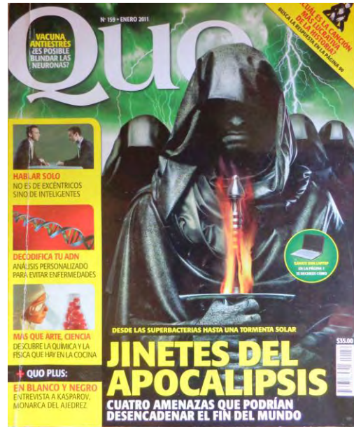
Portada de la revista Quo , no.159, enero 2011

“Profecías 2012 ¿El fin del mundo o el inicio de una nueva era? La verdad sobre las predicciones mayas, en: Muy interesante , enero 2012, no.1, pp. 40-52