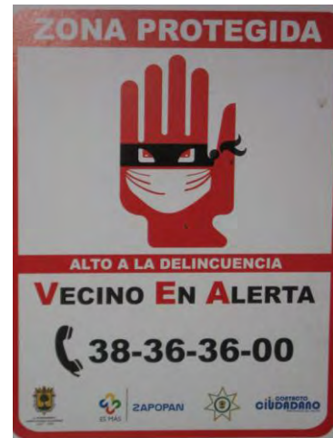
Placa repartida entre los participantes de las juntas “Vecinos en Alerta”