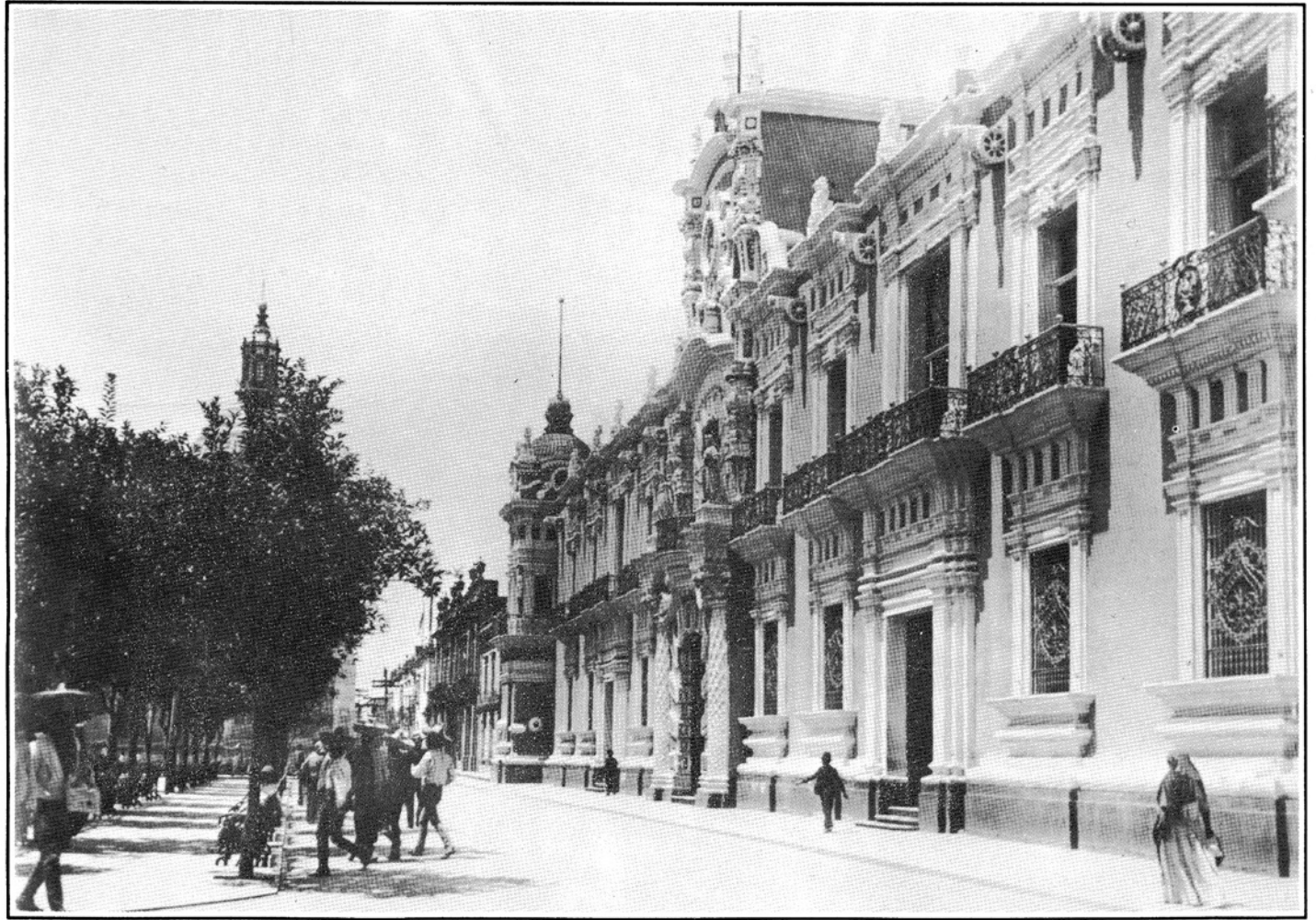
Palacio de Gobierno