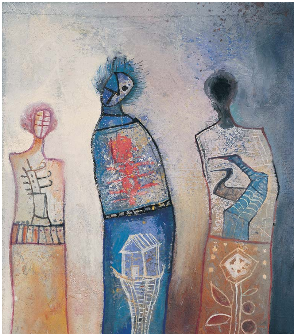
LOS PARIENTES. MIXTA SOBRE TELA 83 x 73 cm, 1999.