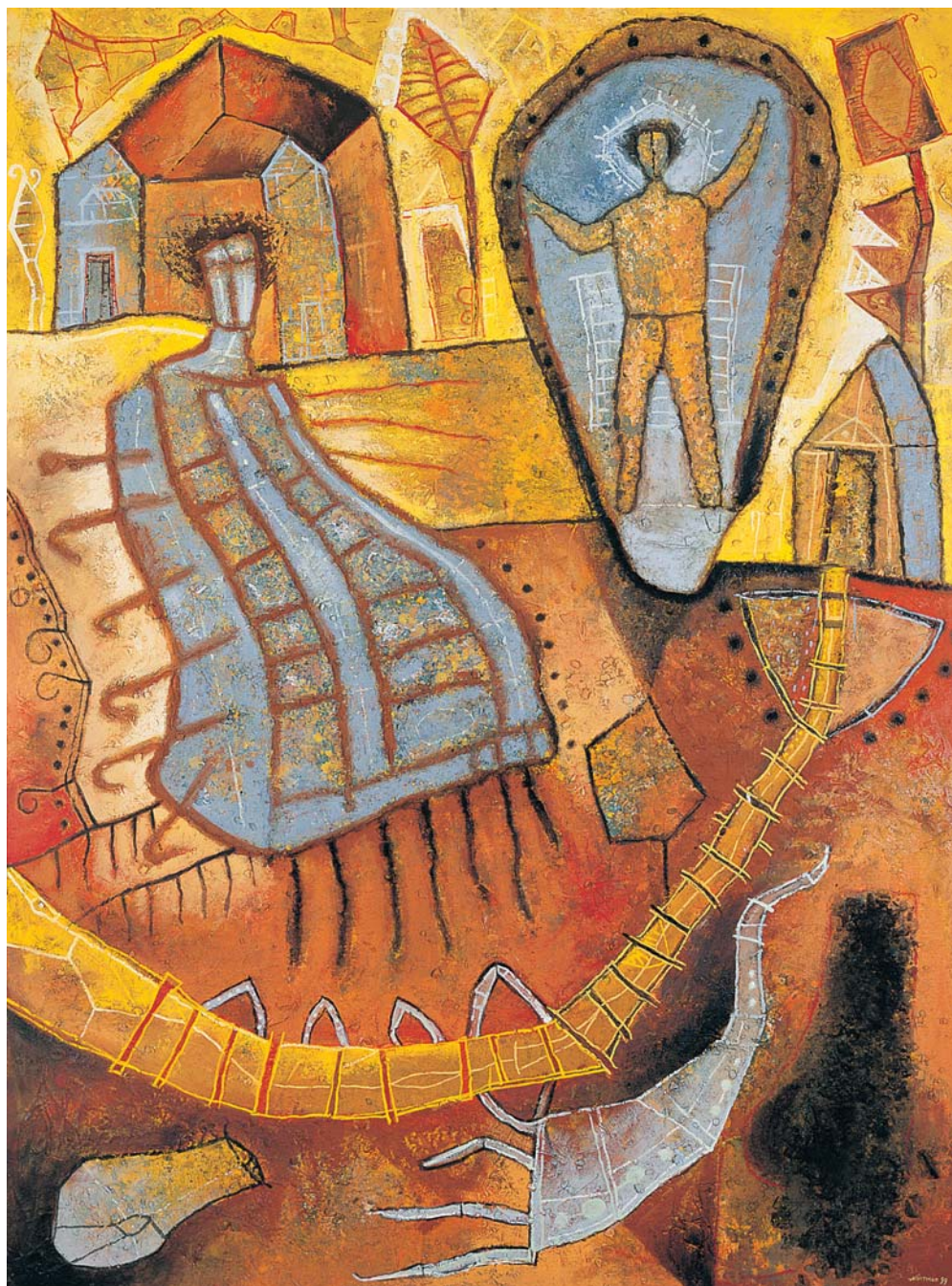
LAS COSTILLAS. MIXTA SOBRE TELA, 175 x 130 cm, 1999.