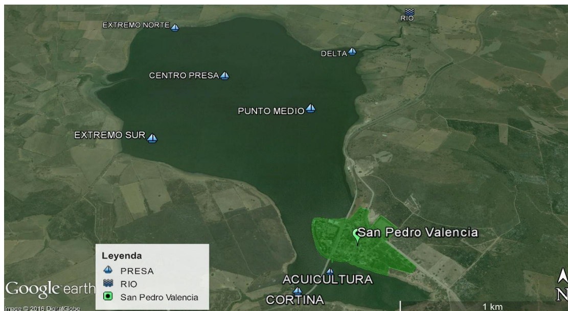
Mapa 1 Puntos de muestreo (fuente: Google Earth, 2016).