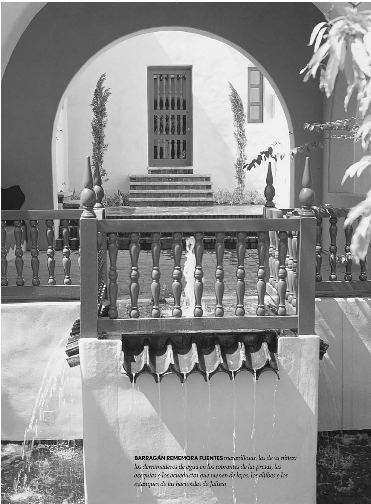
BARRAGÁN REMEMORA FUENTES maravillosas, las de su niñez: los derramaderos de agua en los sobrantes de las presas, las acequias y los acueductos que vienen de lejos, los aljibes y los estanques de las haciendas de Jalisco