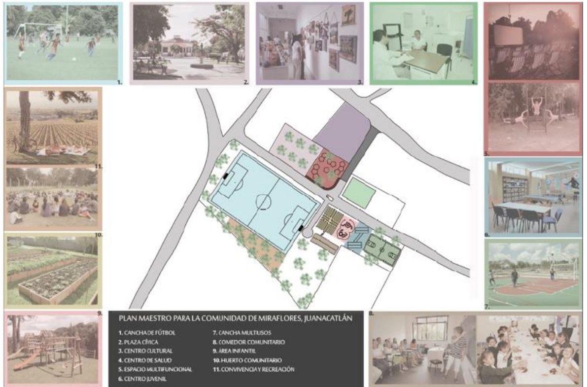
- Proyecto arquitectónico del Centro de Desarrollo para Jóvenes