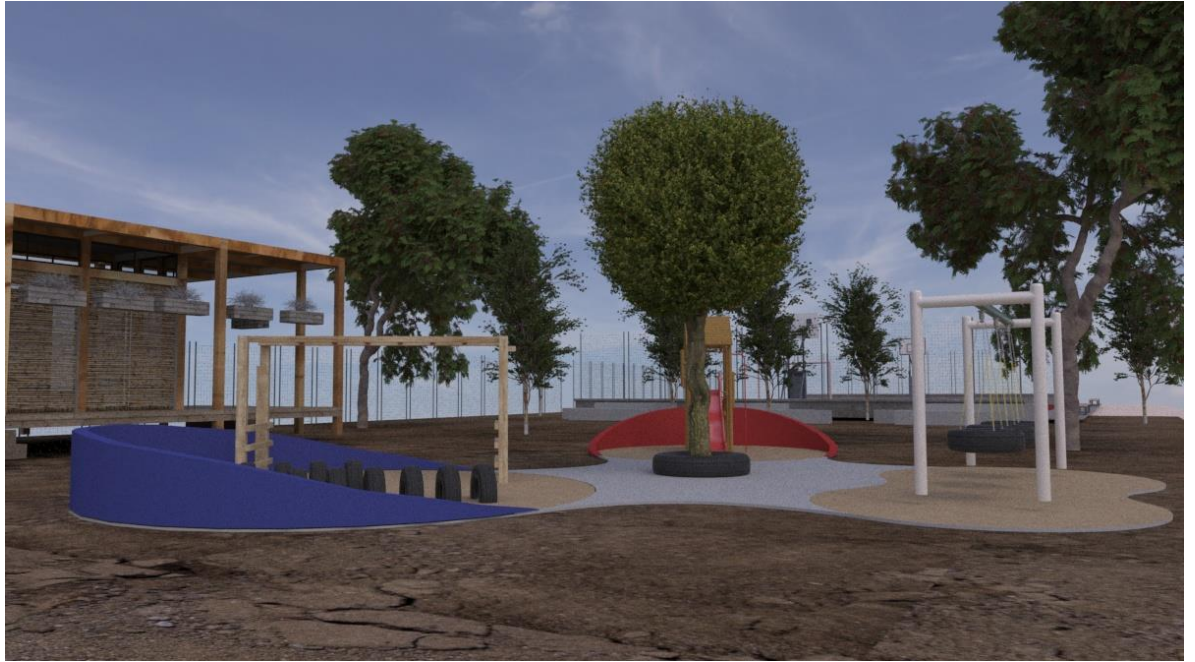
- Proyecto arquitectónico de Espacio Público