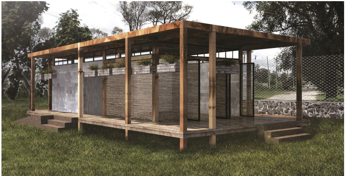
- Proyecto arquitectónico del Centro de Desarrollo para Niños