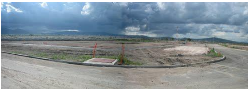
(Homex, Lomas del mirador)

Por otra parte, los arroyos que se localizan en la región Valle generan un aumento potencial de zonas peligrosas, ya que hay problemas en cuanto a su contaminación y también se presentan, cuando los arroyos crecen por las lluvias, deslaves o inundaciones por la falta de control en los cauces, de tal manera que viviendas que se encuentran alrededor sufren afectaciones, por la gran cantidad de agua que se acumula y corre y no hay manera de solucionar el problema actual. Sería interesante saber de que manera dependencias de gobierno llevarían a cabo la solución, pero las juntas vecinales no logran recapitular como es que una dependencia generaría ganancias para ellos mismos sin apoyar la convivencia de los vecinos o generar un espacio apto para los demás.