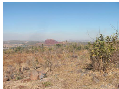
(Villas de Guadalupe)

Se tiene como opción también la implementación de domos o unidades deportivas con lo cual la convivencia no solo será para llevar a cabo conversaciones o actividades recreativas, el deporte es de vital importancia para que un sector mantenga su seguridad y las pandillas no crezcan de manera en que el crecimiento cultural de la zona también lograra salir adelante.