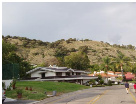
(Cerro de Santa Anita)

El principal problema es que las zonas en las que se puede disponer de terrenos para formar áreas verdes se encuentran en predios privados y/o residenciales, lo que impide que los beneficiados sean los pobladores en su totalidad y solo las utilizan los habitantes de las zonas privadas.