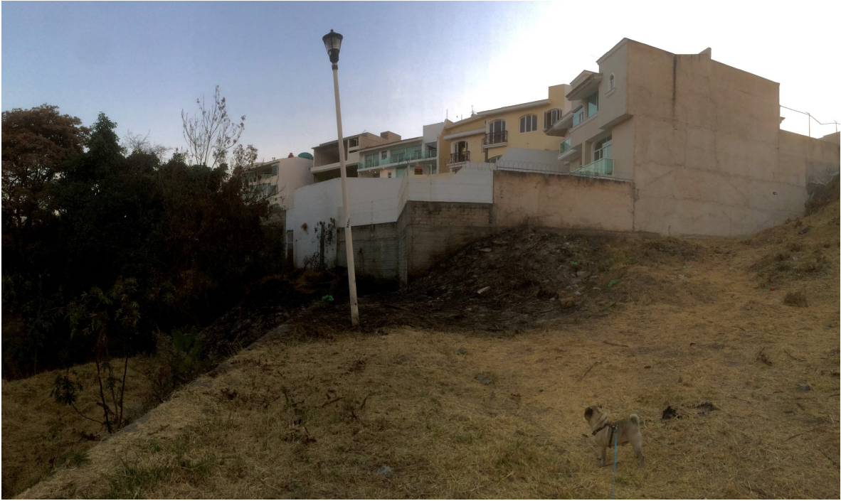
Área común vecina de la capilla de la segunda sección. Por Carlos Yamil Neri