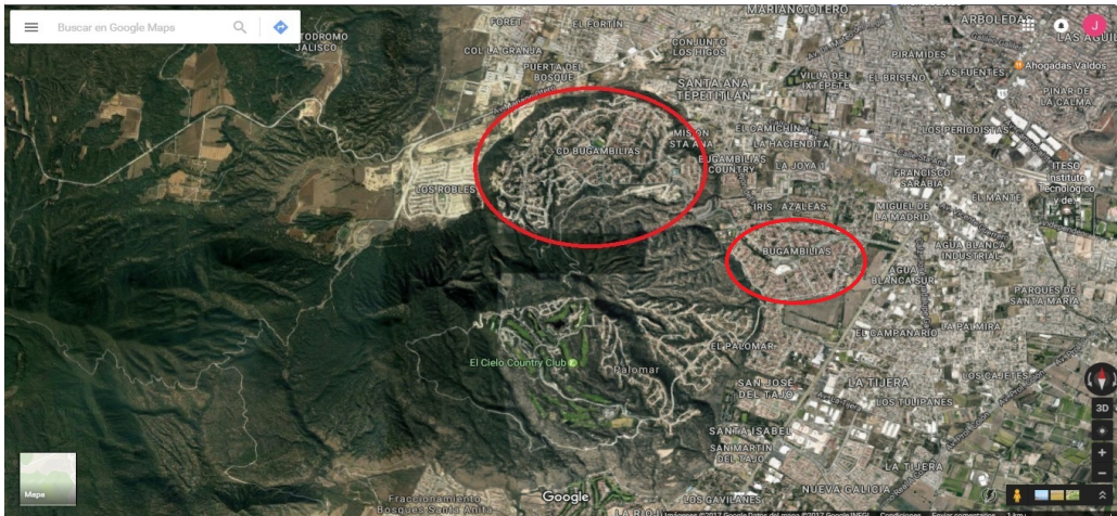
Fotografía 2. Ciudad Bugambillas, primera y segunda sección