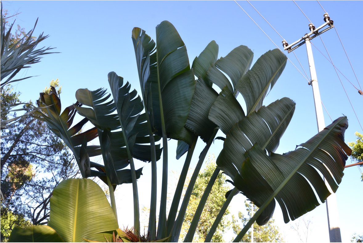
Palmeras y alumbrado público no convencional con el modelo de cableado inicial (subterráneo) en la primera sección. Por Carlos Yamil Neri