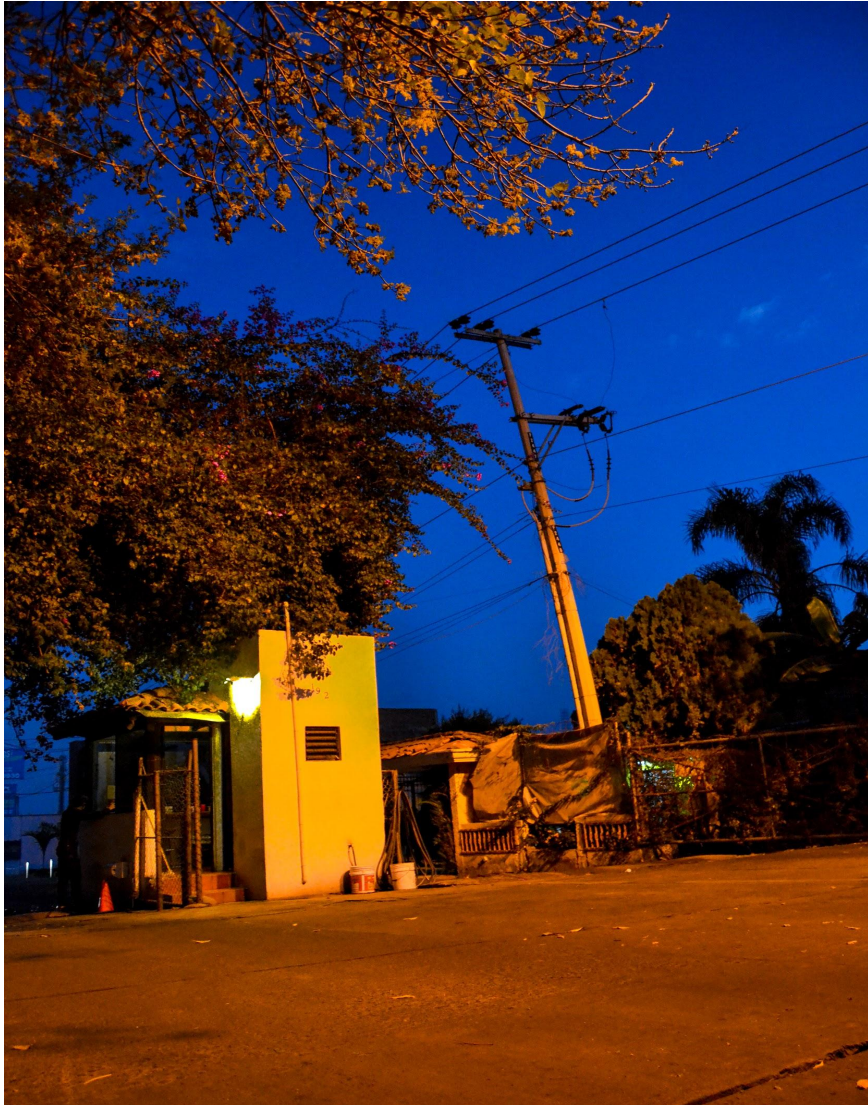
Caseta alterna a Bugambilias al lado de Telmex. Entre 6 y 7 pm, al cambio de turno de todos los puestos de vigilancia.