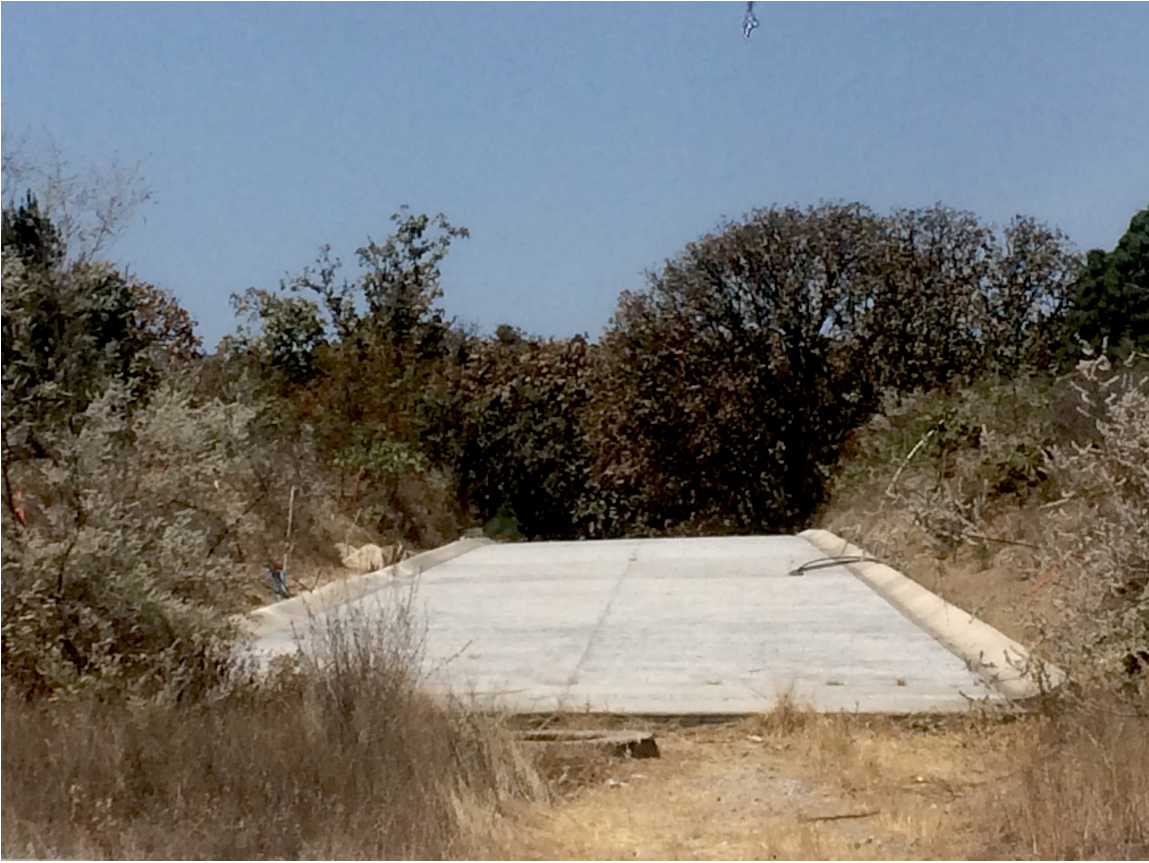
Nuevos fraccionamientos en segunda sección. Por Carlos Yamil Neri