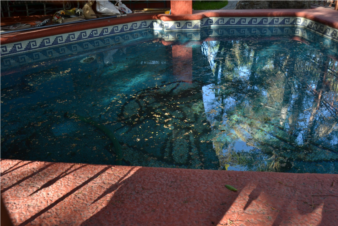
Patio trasero de casa en primera sección, colinda con el área verde.