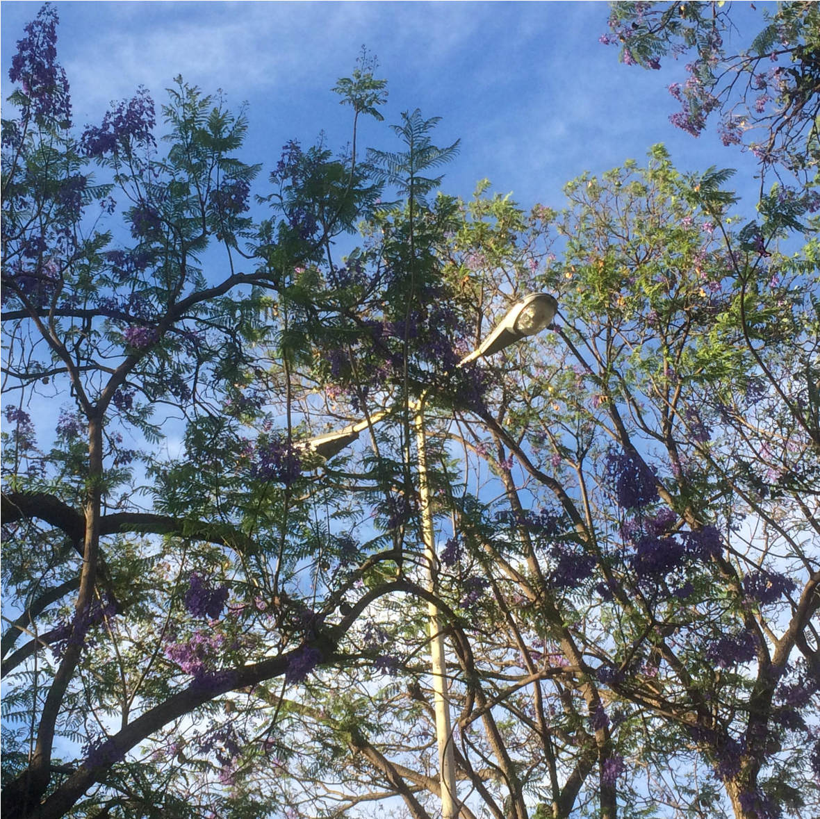
Alumbrado público subterráneo. Por Carlos Yamil Neri