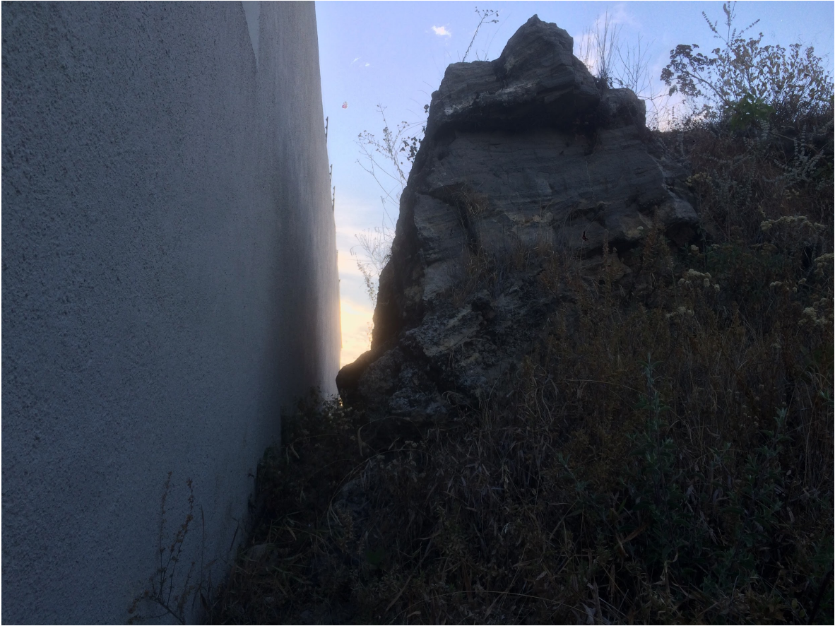
Suelo original, segunda sección. Por Carlos Yamil Neri