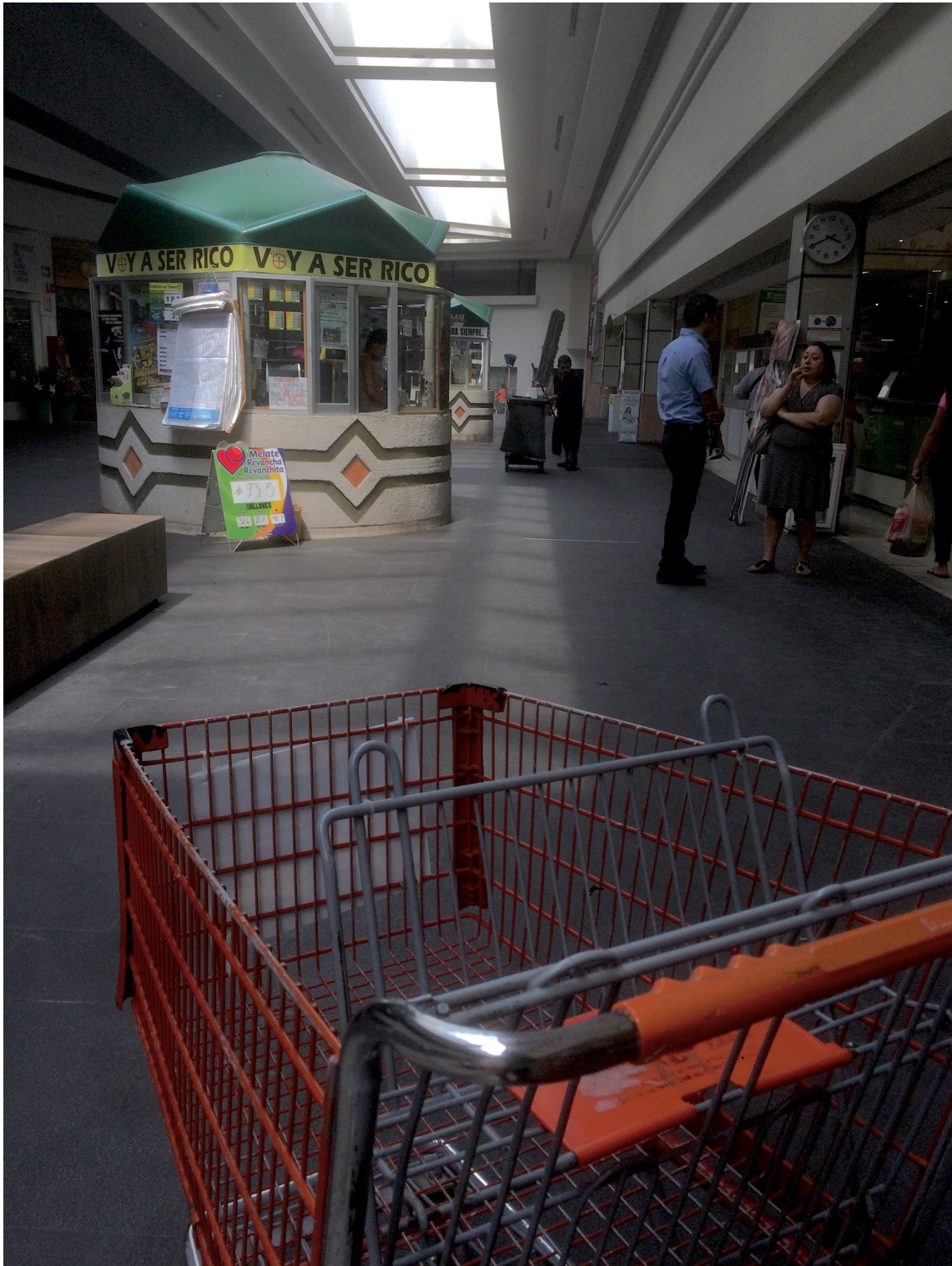
Voy a ser rico. Por Carlos Yamil Neri