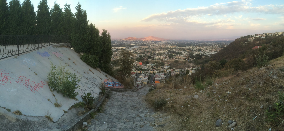
Entrada a capilla, de Santa Ana a segunda sección de Bugambillas. Por Carlos Yamil Neri