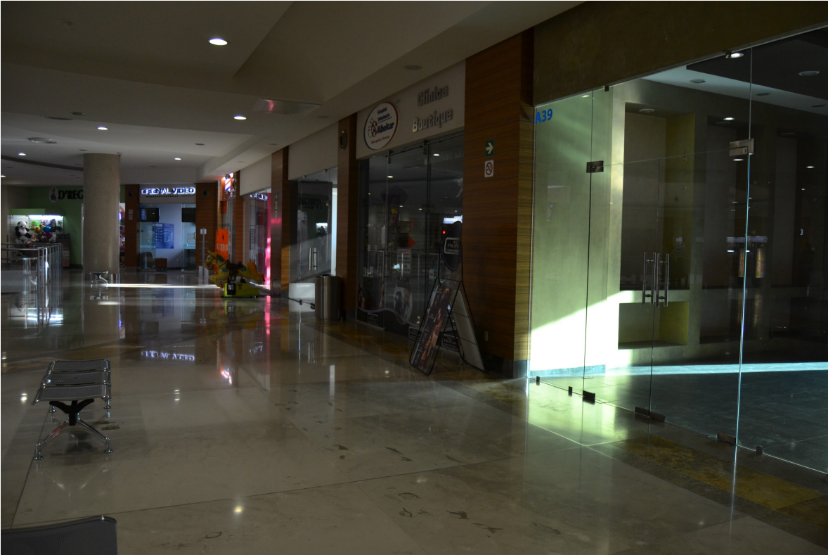
Locales en funcionamiento y uno vacío al interior de plaza panorámica. Por Carlos Yamil Neri