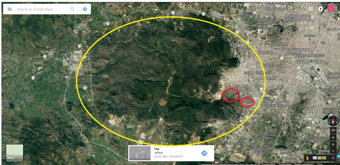
Fotografía 1. Relación bosque – Ciudad Bugambilias

Debido a esta actividad económica se han ampliado los espacios para la edificación de cotos por constructoras privadas, lo que ha significado la deforestación de 20 hectáreas por cada 18 mil habitantes en el bosque de La Primavera, de acuerdo con Agustín del Castillo (en entrevista), y la pavimentación de la ruta del agua que antes corría a través del cerro y ahora se desvía o estanca debido a la presencia de casas y calles, alterando su captación natural, lo que ha ocasionado un impacto ecológico considerable en el bosque y la modificación de la geografía de esta parte del área metropolitana de Guadalajara. Qué no se separe de la problemática ambiental que afecta a la AMG, es por eso importante señalar lo que aquí se hace y deja de hacer en cuanto a la captación de agua y preservación del bosque para el buen clima y aire en toda la ciudad.