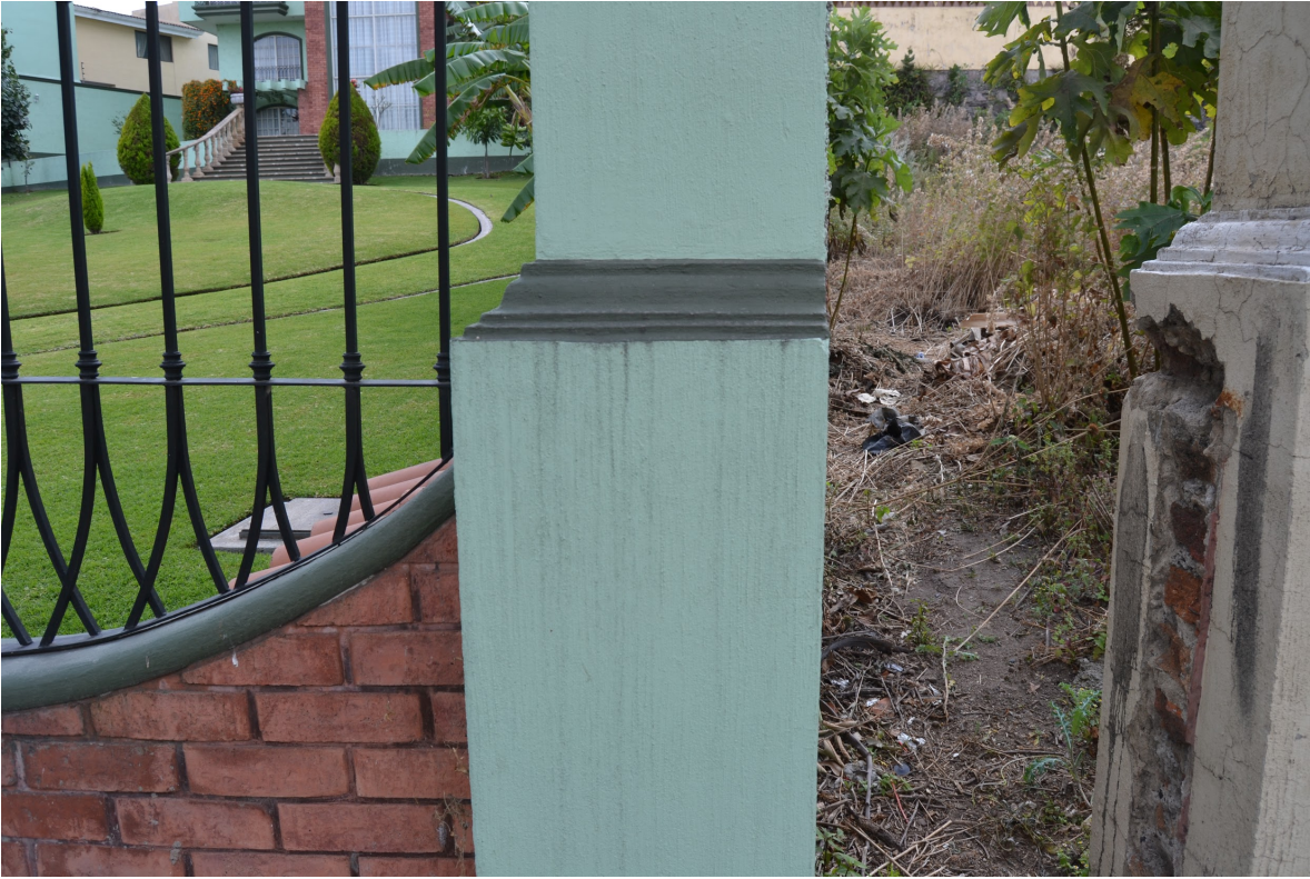
Diferencia de suelo entre casa ubicada frente a la plaza panorámica y terreno baldío. Por Carlos Yamil Neri