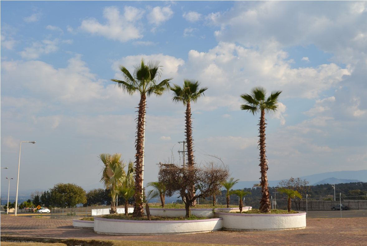
Palmeras en camellón frente a la plaza panorámica, en la segunda sección del fraccionamiento. Por Carlos Yamil Neri