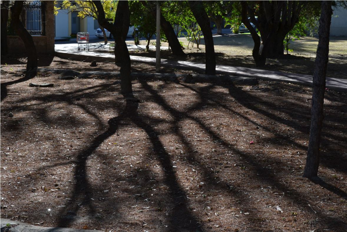
Carrito de soriana abandonado en camino de área común en primera sección.. Por Carlos Yamil Neri