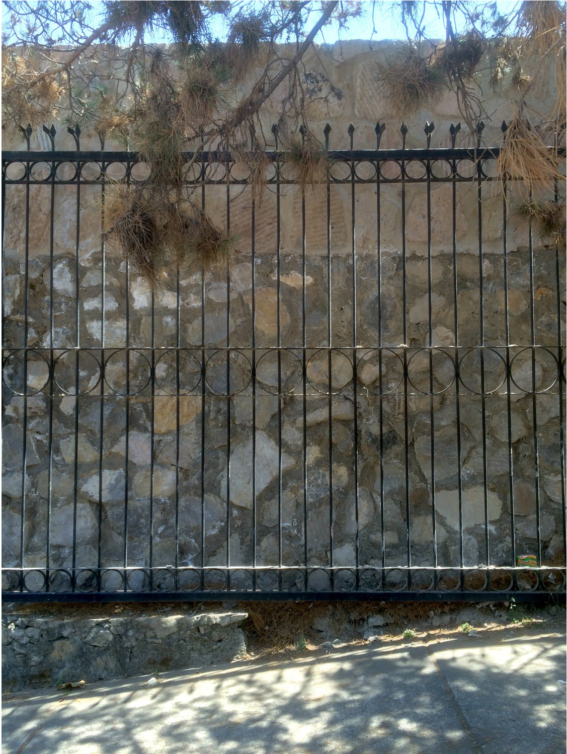
Villas, segunda sección. Por Carlos Yamil Neri