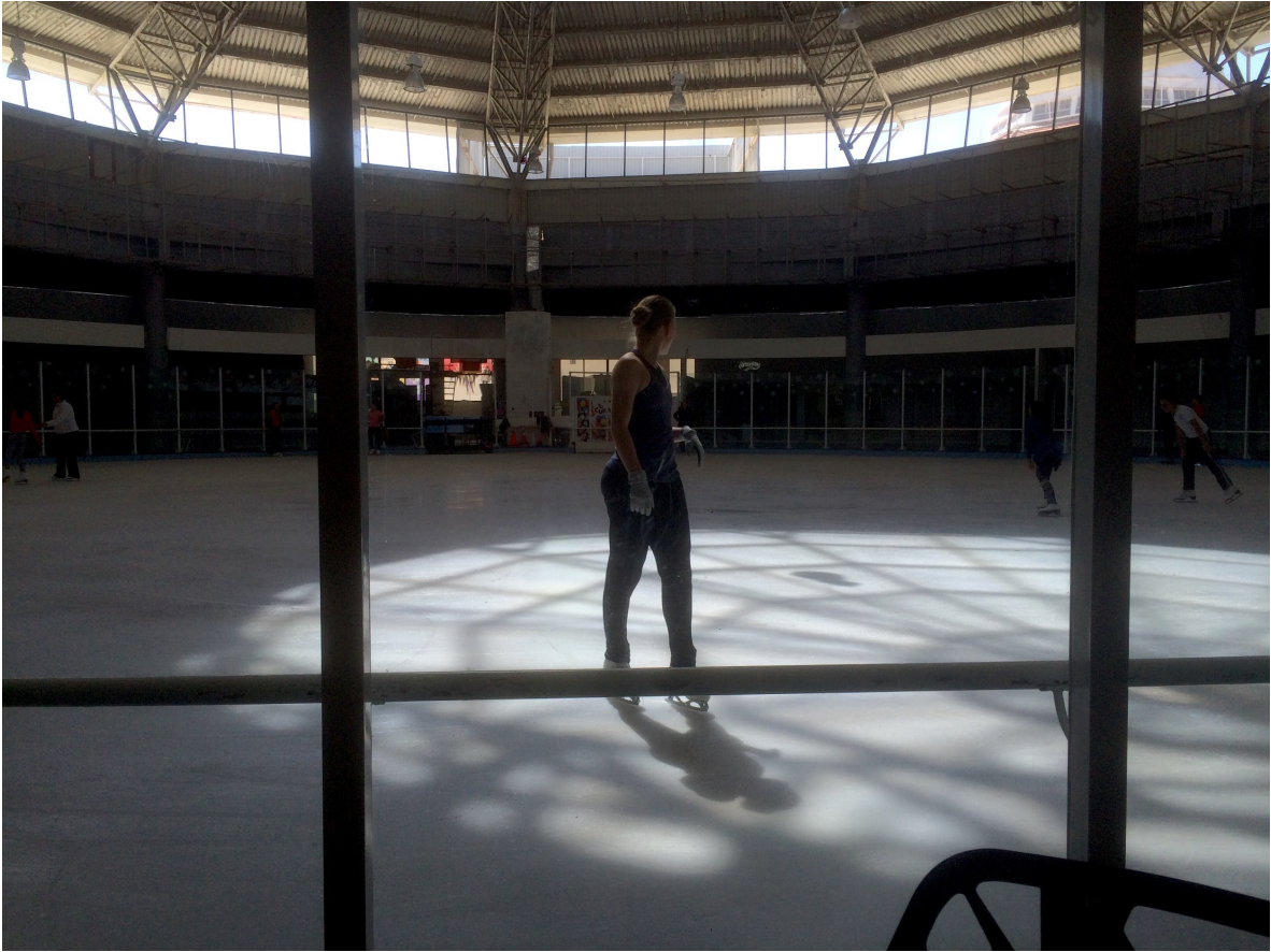
Maestra en pista de hielo. Por Carlos Yamil Neri