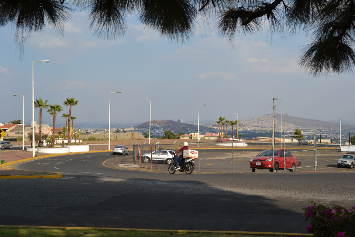
Capa asfáltica de la glorieta y estacionamiento para trabajadores de plaza panorámica. Camino que conecta el fraccionamiento con los que viven abajo y los de arriba.