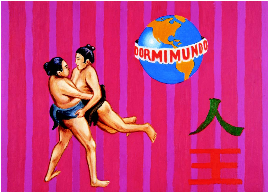
Sin título , de la serie "Marca registrada", óleo sobre madera, 12 x 17 cm, 2001.