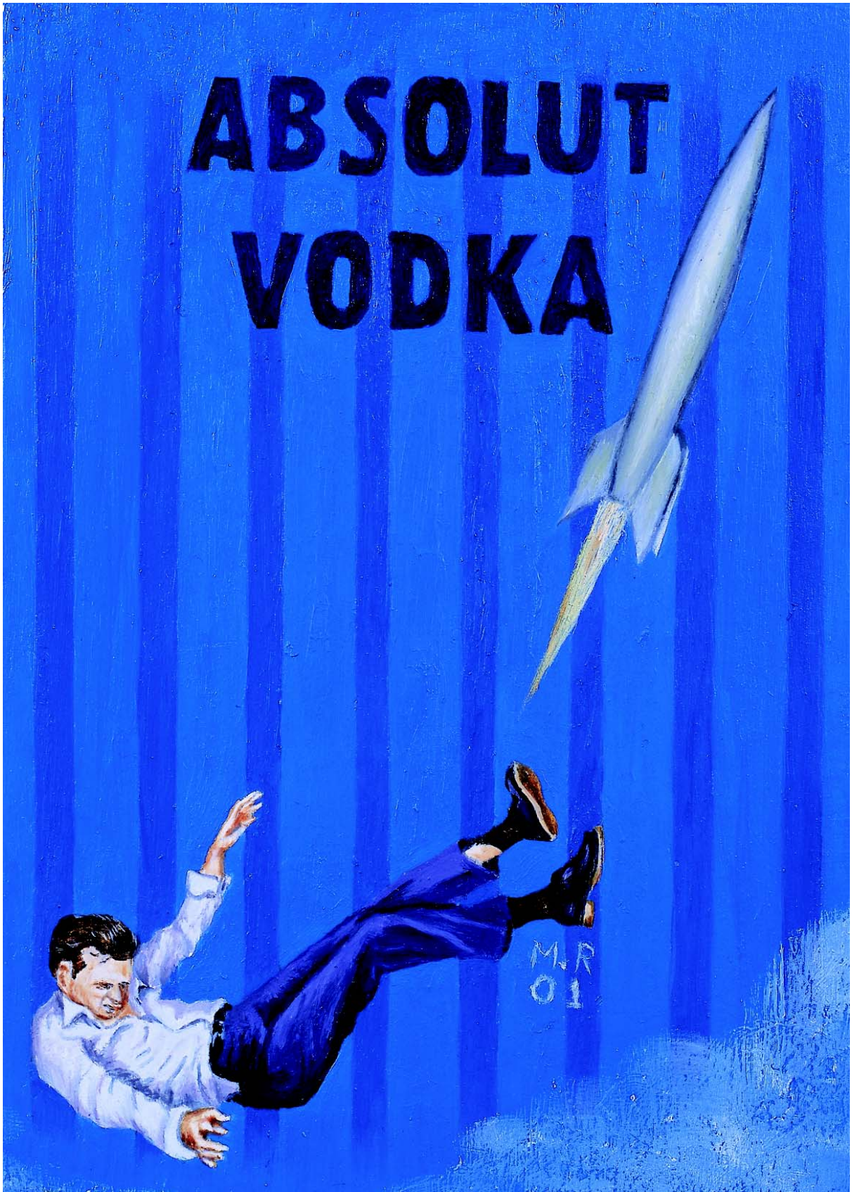
Sin título , de la serie "Marca registrada", óleo sobre madera, 17 x 12 cm, 2001.