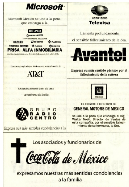
Ejemplos Esquelas tomados del libro de El Lenguaje de la inmortalidad de Eulalio Ferrer

La popularidad siempre va a ser un buen medio para llegar a la gente. Ya sea para vender o simplemente para promocionar la marca es importante recurrir al pensamiento colectivo de quién es una celebridad. “En un sentido similar, en varias ocasiones la publicidad macabra consiste en simplemente echar la mano del prestigio de los muertos célebres para anunciar su producto” (Ferrer, 2003) Es el caso de la marca BIC que utilizó la muerte de Mario Moreno Cantinflas para hacer promoción de su marca: