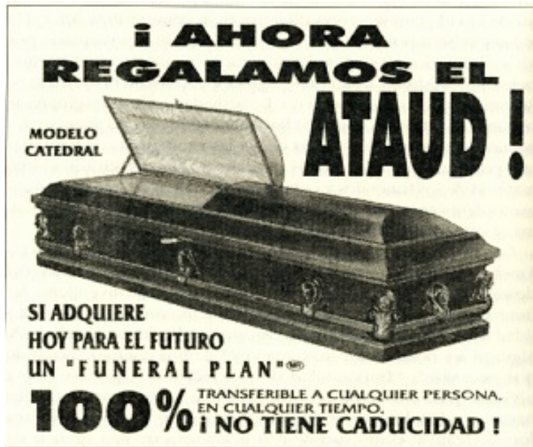
Promoción de una agencia de inhumaciones de México. Imagen extraída de El Lenguaje de la Inmortalidad de Eulalio Ferrer

Con el paso del tiempo cada uno de los negocios se hace más competitivo y en los negocios mortuorios no es la excepción. Al contrario, se acrecienta la demanda es por eso que los distintos negocios tienen que idear planes más atractivos para jalar a más público. Es por eso que se crean los planes de promoción por inauguración: