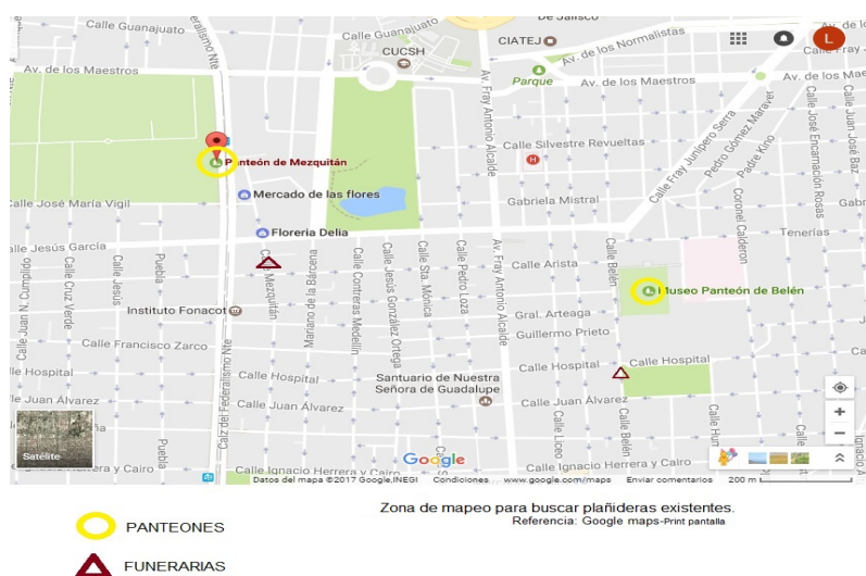
Mapa 1 Ubicación de panteones y funerarias cerca del panteón de Mezquitán

Primero era necesario adentrarme en el conocimiento de la existencia de plañideras en la actualidad en el Área Metropolitana de Guadalajara (AMG). Para esto llamé y visité varias funerarias para tratar de obtener información sobre las plañideras. Comencé por las funerarias establecidas en el centro de Guadalajara, pensando que ahí se encontrarían los más antiguos.