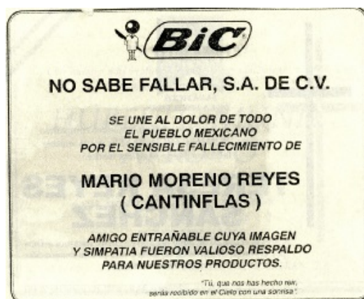
Esquela de Cantinflas patrocinada por la marca Bic Extraída del libro de El Lenguaje de la Inmortalidad de Eulalio Ferrer

La popularidad siempre va a ser un buen medio para llegar a la gente. Ya sea para vender o simplemente para promocionar la marca es importante recurrir al pensamiento colectivo de quién es una celebridad. “En un sentido similar, en varias ocasiones la publicidad macabra consiste en simplemente echar la mano del prestigio de los muertos célebres para anunciar su producto” (Ferrer, 2003) Es el caso de la marca BIC que utilizó la muerte de Mario Moreno Cantinflas para hacer promoción de su marca: