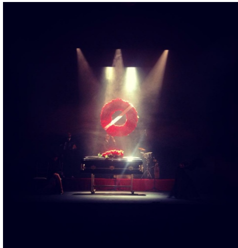
Portada del cartel de la obra de teatro Plañideras en 2014 . Extraído de: Garuyo

La obra de teatro Las plañideras , de Dionisia Fandiño, se representó en el teatro Sergio Magaña de la Ciudad de México en diciembre de 2014. Es una obra dancística en la que dos plañideras convergen en el mismo funeral, donde se desata la rivalidad de éstas. A pesar de estar basada en los rituales del antiguo Egipto, se trata totalmente de una comedia.