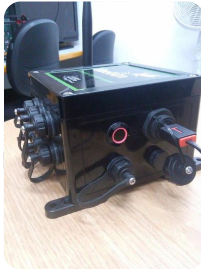
Ilustración 2. Wasmote Plug & Sense!

estado del acelerómetro interno y el ID del dispositivo. El código generado puede ser replicado para cualquier nodo Wasmote.