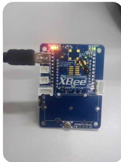
Ilustración 3. Nodo ZigBee

Pero a pesar de que se logró enviar los datos como se esperaba, se tuvo que seguir analizando y probando el producto, ya que debido al uso que se le pretendía dar, los resultados parciales no eran útiles, después de analizar detalladamente los nuevos requerimientos, se pudo concluir que el Modulo ZigBee no es útil debido a que el Meshlium espera recibir un frame específico y al utilizar la configuración deseada para el XBee, dicho frame no puede ser modificado y no cuenta con las especificaciones requeridas por el Meshlium.