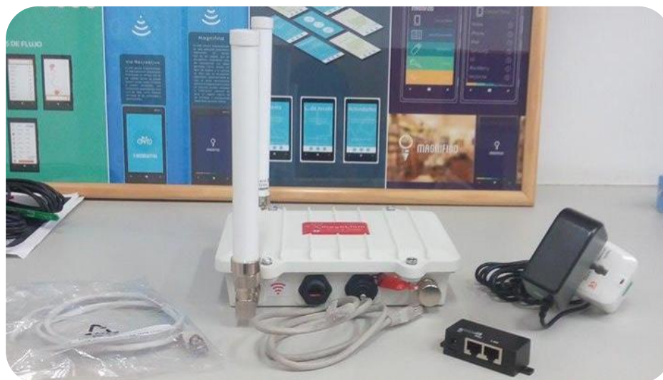
Ilustración 1. Meshlium

Este es el nombre del Gateway comercial ZigBee utilizado. Inicialmente se tenía como supuesto que se tendría que modificar el File System del Meshlium utilizando Linux, sin embargo, al comenzar con las pruebas y la investigación previa sobre su funcionamiento, dicho supuesto se rechazó. El Meshlium cuenta ya con un sistema de administración, el sistema está ya pre configurado para estar recibiendo los datos de forma continua.