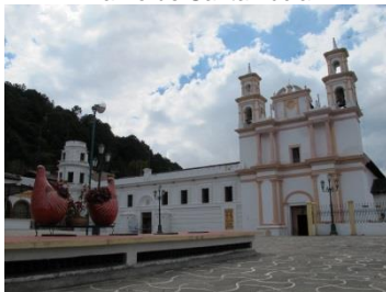
Barrio de La Merced