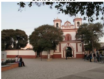
Barrio de El Cerrillo