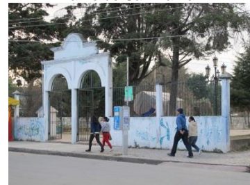
Barrio de Tlaxcala