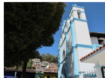
Barrio de San Antonio