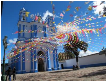
Barrio de Santa Lucia