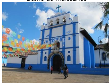
Barrio de Cuxtitali