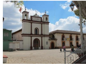
Barrio de San Ramon