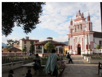
Barrio de Mexicanos