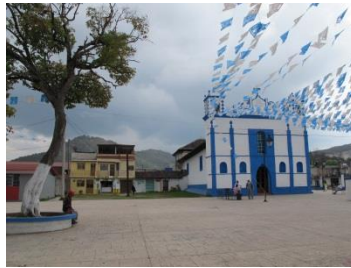
Barrio de San Diego