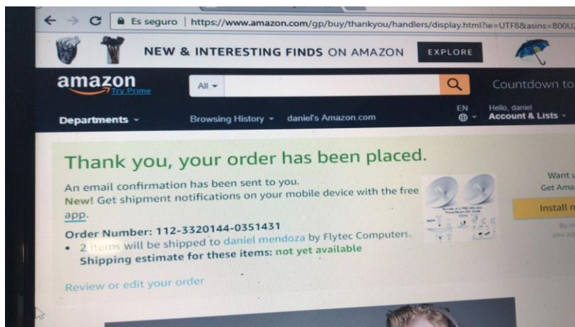
Imagen 1: compra con proveedor extranjero para reducción de costos.