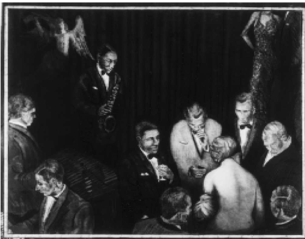
Donde el pavor de la delicia mora, fotografado, aguatinta y aguafuerte, 49 x 64 cm, 1995.

territorial que pretende dar una respuesta estratégica a los problemas estructurales de desarrollo de Galicia. Este nuevo modelo, impulsado por el gobierno regional, cuestiona la eficacia de muchas de las políticas tradicionales que han concentrado las medidas de desarrollo en torno a algunas áreas urbanas y grandes ejes de transporte.