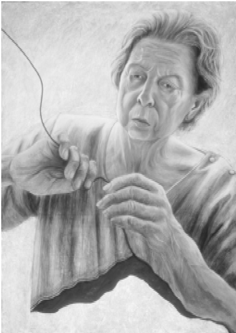
Deshilado, acrílico sobre tela, 137 x 190 cm, 1999.

de los famosos círculos de calidad o calidad total en el interior de una planta; en realidad se refiere a aplicar este sistema en la colaboración entre diversas empresas, instituciones y personas. Incentiva a cuestionar por qué no aplicamos la metodología de calidad total no solamente a lo que hacemos en el interior de nuestra empresa sino también al trabajo con otras empresas e instituciones.