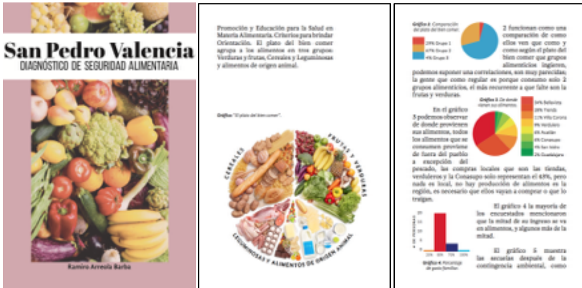
2. Páginas muestra del Diagnóstico de Seguridad Alimentaria.