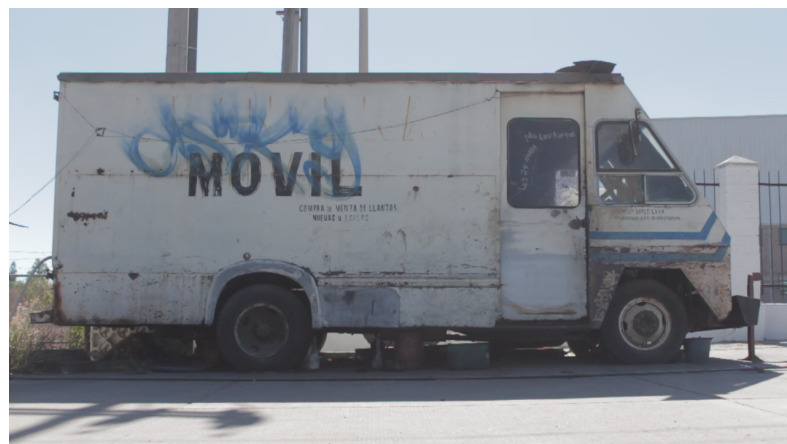
Imagen con corrección de color