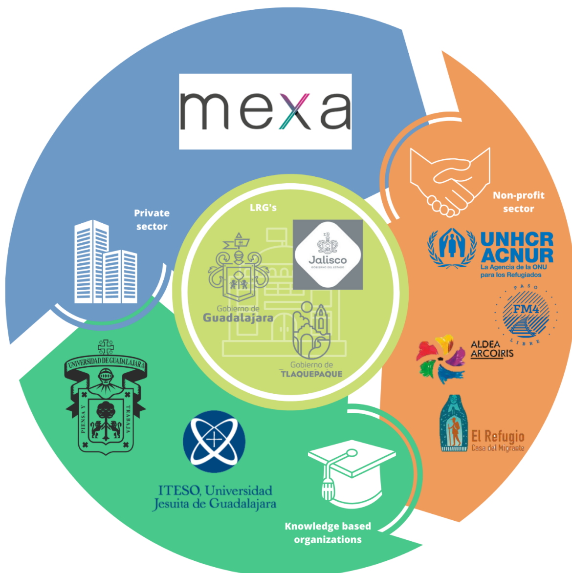
Figura 3: Vinculación de actores en la Red de la Oficina de ACNUR