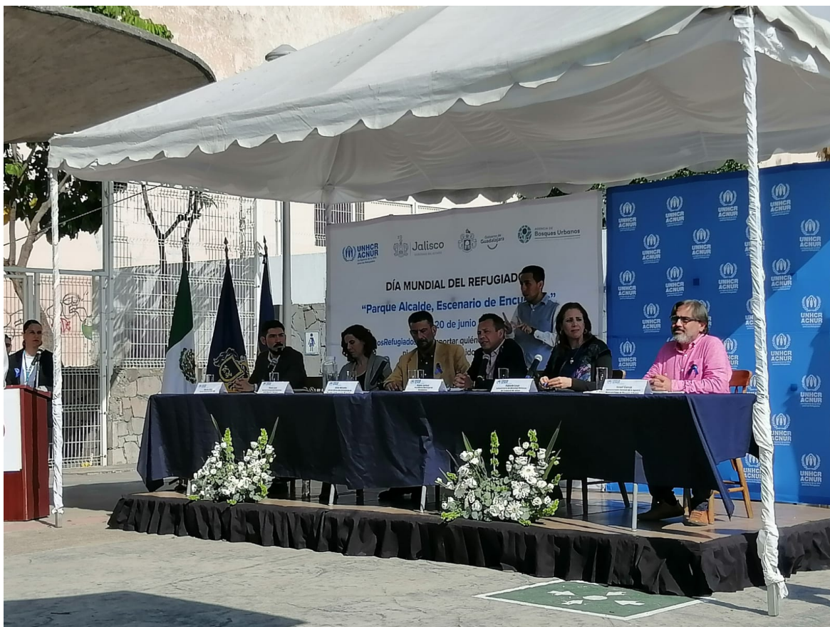
Imagen 2: Día Mundial del Refugiado en Parque Alcalde

contó con la presencia de personas de diferentes instituciones gubernamentales, académicas y organizaciones civiles y se discutieron las implicaciones de la movilidad humana.