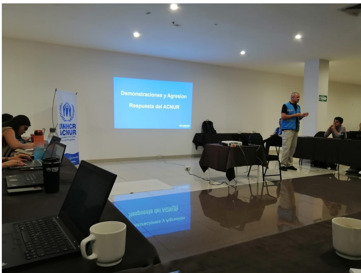
Imagen 1: Capacitación de Seguridad de la Oficina Regional

De igual forma, lleve a cabo la realización de una herramienta de sistematización de información sobre el flujo de ocupación de los albergues del AMG. Esta herramienta tenía el objetivo de permitirle al equipo interno de poder conocer los espacios disponibles en cada albergue, y de esta forma, realizar la canalización de casos de forma coordinada y organizada. La sistematización se realizó a partir de los monitoreos semanales de los albergues de FM4 y Aldea Arcoíris, que hacen llegar a las oficinas de ACNUR de Guadalajara. En esta herramienta, trabaje la información de tal manera que se conociera cuantos espacios hay disponibles para mujeres, cuantos para hombres y cuantos para la comunidad LGBTIQ+.