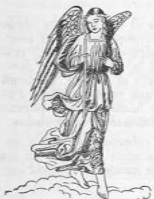
Velas de Cera "Vérfitas" Siempre las Mejores