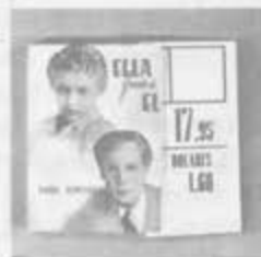
Forja de hombres