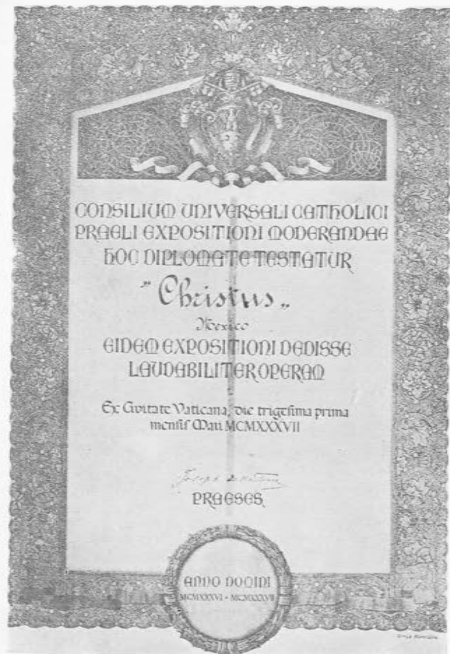
Reproducción del Diploma que acabamos de recibir otorgado a "CHRISTUS" en la "Exposición Universal de la Prensa Católica", celebrada en Roma.