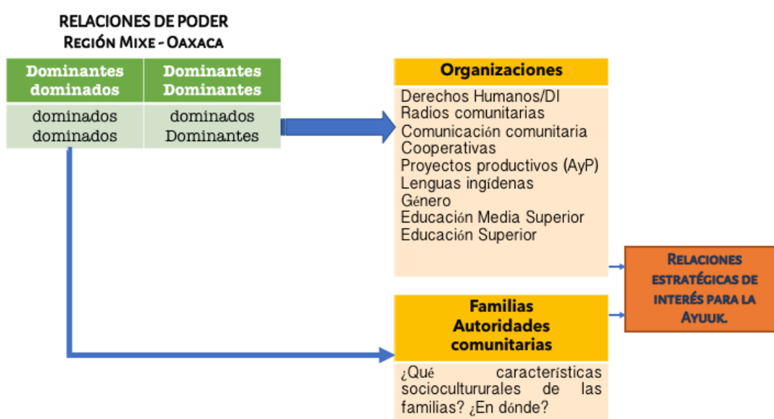
Ilustración 2. Reflexiones sobre la vinculación social. (2018)

El primer paso fue una reunión colectiva de cuatro días (2 – 5 de julio de 2018) para replantear la planificación estratégica 2016 – 2021, resultado de ello son algunos esquemas que sintetizan los aportes de docentes, administrativos y asesores del Sistema Universitario Jesuita, de la Universidad Centroamericana de Nicaragua y de la Comunidad de Aprendizaje Comparte.