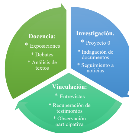
Ilustración 1. Propuesta para equilibrar el quehacer educativo del ISIA. (2018)

En la ilustración 1, se plantean algunos ejemplos de actividades que los docentes puedan enriquecer y mejorar para transitar de manera gradual hacia un esquema que fortalezca las tres estrategias fundamentales del instituto: docencia, investigación y vinculación comunitaria.