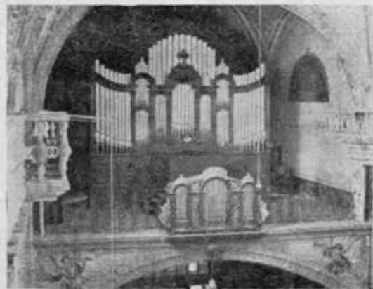
Organ de Dolores Hidalgo, — Gto. —