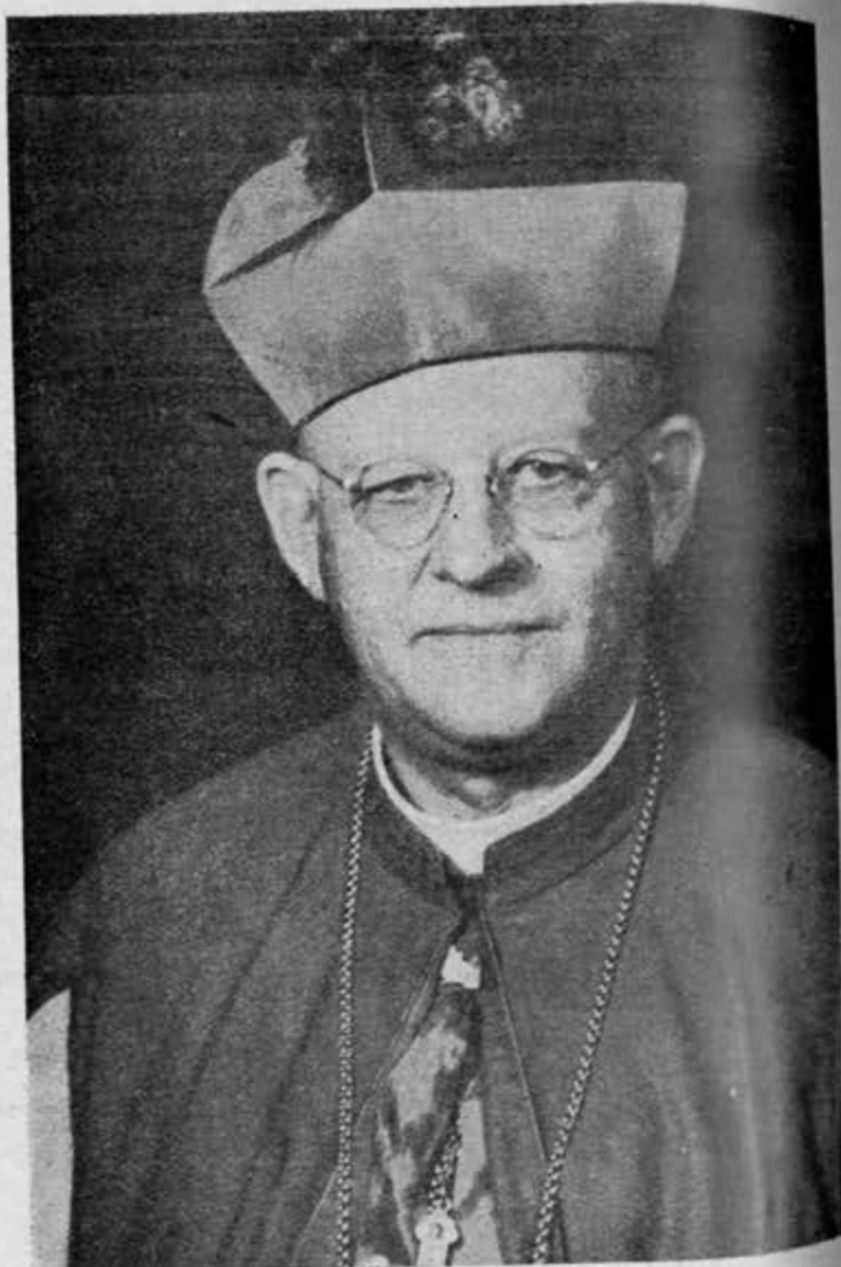
Excmo. y Rdmo. Sr. Don Rodolfo Gerken, Arzobispo de Santa Fe, gran amigo de los mexicanos y bienhechor del Seminario Pontificio de Montezuma.

braron una fiesta religiosa en honor de la Sagrada Familia y a ella fueron invitados particularmente todos aquellos que contribuyeron de alguna manera a la apertura de la casa de Dios. Qué diéramos muchos católicos por ver nuestras iglesias, dedicadas a muchos usos por las autoridades, nuevamente dedicadas para siempre al culto. Sería una grande ayuda para que no se perdiese la fe y para conservar las buenas costumbres y por ende reconstruir la esencia de la nacionalidad tan grandemente lastimada.