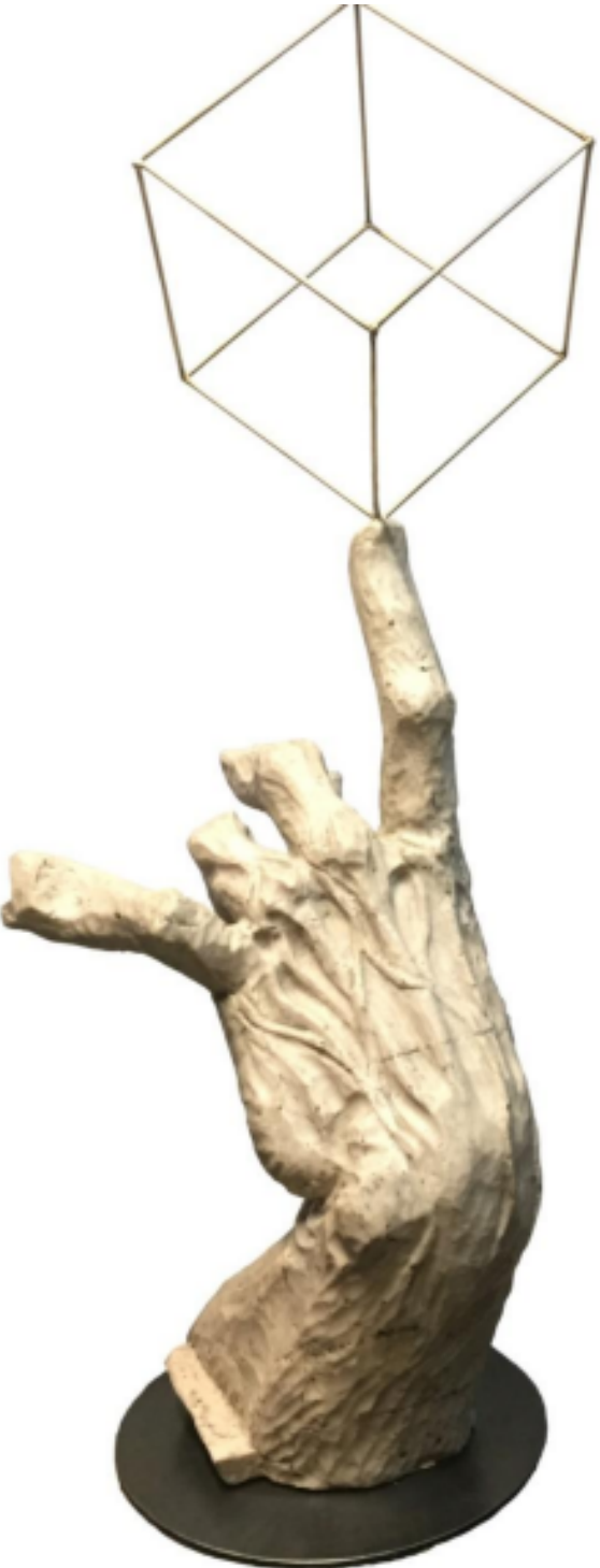
Título: Equilibrio cubo bronce Técnica: vaciado en resina poliéster, marmol (negro grafito) y acero al carbón. Dimensiones: 80cm Alto x 33cm Ancho x 30cm Largo. Año: 2016 Precio: $45,000 Mx