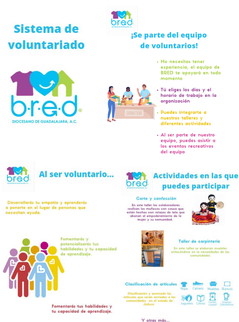
Ilustración 1: Secciones del folleto de información de sistema de voluntariado

En cuanto al proyecto con BRED, se hicieron entrevistas que resultaron en insumos importantes para las siguientes fases del proyecto. Posteriormente, hubo una sesión de cocreación con un miembro de la organización. Después, se propusieron tres propuestas de rediseño en cuanto a los voluntarios, iteró y validó la propuesta más viable. Una vez que las propuestas se finalizaron, se procedió a elaborar los prototipos entregables a la organización, dado que se trabajó de acuerdo con tópicos de interés, cada área desarrolló una propuesta diferente. En nuestro caso se trata de un manual de sistema de voluntariado y un manual de capacitación.